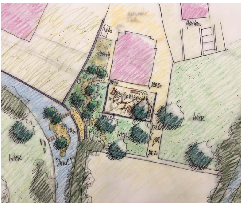
Der Haselbach soll neu zugänglicher und gleichzeitig ökologisch aufgewertet werden. Die Skizze zeigt die erste Projektidee.

Tischer: Wir bleiben aber dran und verfolgen verschiedene Möglichkeiten, den noch fehlenden Betrag zu beschaffen.