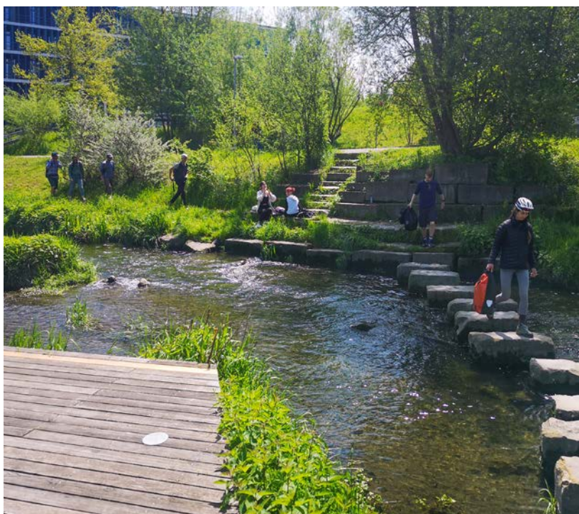
Hier in Dübendorf kann man den Chriesbach seit geraumer Zeit direkt erleben. Der Zugang wird rege genutzt.