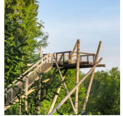
Beobachtungsturm in den Thurauen.