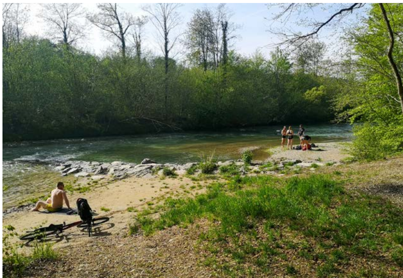
Kiesbänke bieten vielseitige, direkte Wasserzugänge zum Baden und Picknicken. Hier an der Töss beim Reitplatz in Winterthur.

Zum anderen können Gemeinden und andere Organisationen einen finanziellen Beitrag an ihre eigenen Projekte für neue öffentliche Zugänge zu kantonalen Fließgewässern beantragen. Sind die Anforderungen erfüllt, übernimmt #hallowasser zwischen 45 und 90 Prozent der Kosten für Planung und Bau.