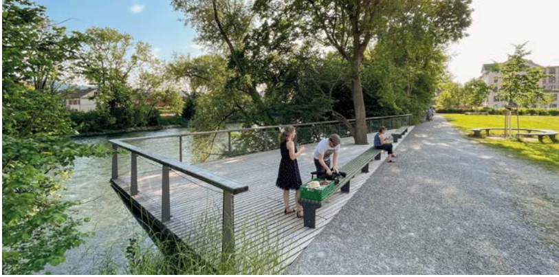
Beim «Park am Wasser» in Zürich blickt man von einer Plattform aus über die Limmat.