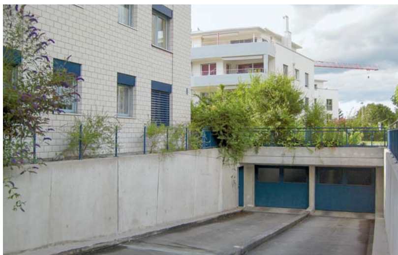
Heikel: Ein- und Ausfahrt direkt vor dem Wohnzimmerfenster mit Sicht auf die schallharten Rampenwände.

Die Tiefgarageneinfahrt sollte möglichst geschickt platziert werden, nach dem Motto: «Lärm gehört zu Lärm.» Im Gestaltungsplanverfahren oder Architek-