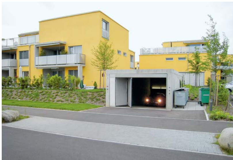
Gutes Beispiel zur Lärmreduktion: Einfahrt nah an der Strasse, von Wohnräumen abgewandt und eingehaust.

Werkzeuge für die Lärmberechnung: www.bauen-im-laerm.ch → Neuanlagen/ Parkierung Informationen für eine Grobabschätzung und Berechnungswerkzeuge für Park- flächen und Tiefgaragen