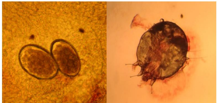
Abbildung 2. Direktmikroskopie mit Nachweis von Eiern und Skybala (links) resp. einer Skabiesmilbe (rechts)