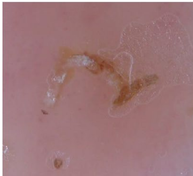
Abbildung 1. Positives Delta-Sign in der Dermatoskopie

Bei immunsupprimierten Patienten können Millionen von Milben vorhanden sein, die zum Bild der Scabies norvegica oder crustosa führen mit einem psoriasiformen Bild bis zur Erythrodermie mit Schuppung und Hyperkeratosen. Komplikationen treten vor allem durch bakterielle Superinfektionen auf.