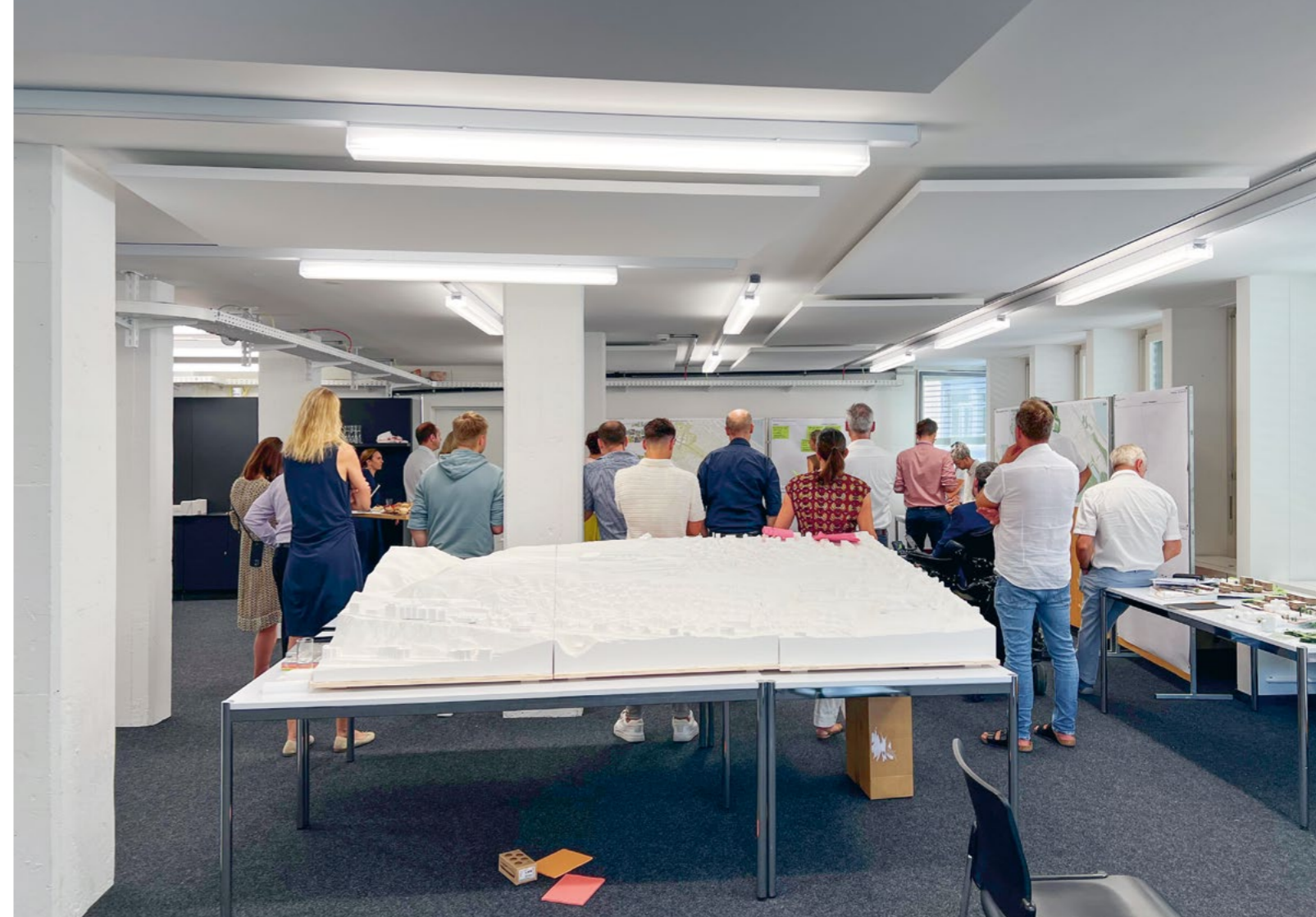
Bild Erster Workshop des Varianzverfahrens: Der Vergleich von unterschiedlichen Ideen der Planungsteams führt zur besten Lösung