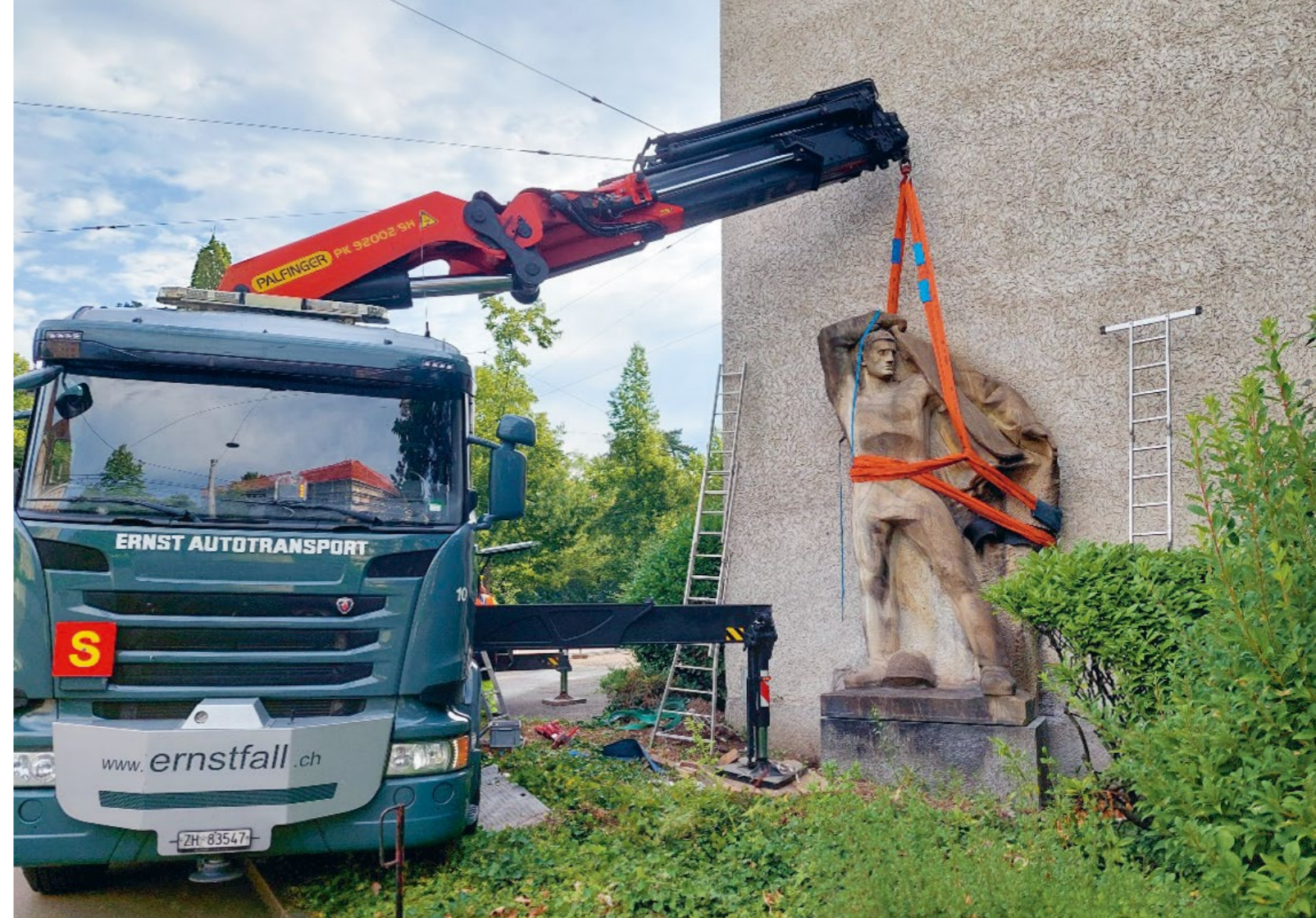
Bild Demontage und Abtransport der Steinskulptur wegen des Rückbaus der Turnhalle für das FORUM UZH