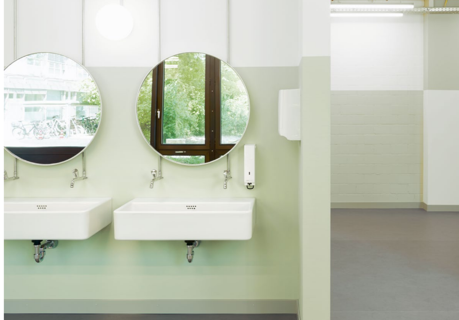
Bild Korridorbereich Klassenzimmertrakt