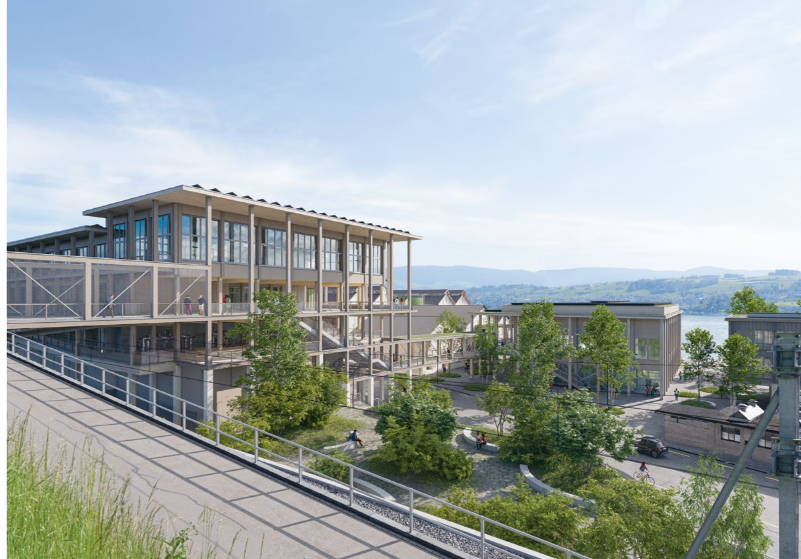
Bild Blick von der alten Landstrasse auf das MINT-Gebäude, im Hintergrund die Aula