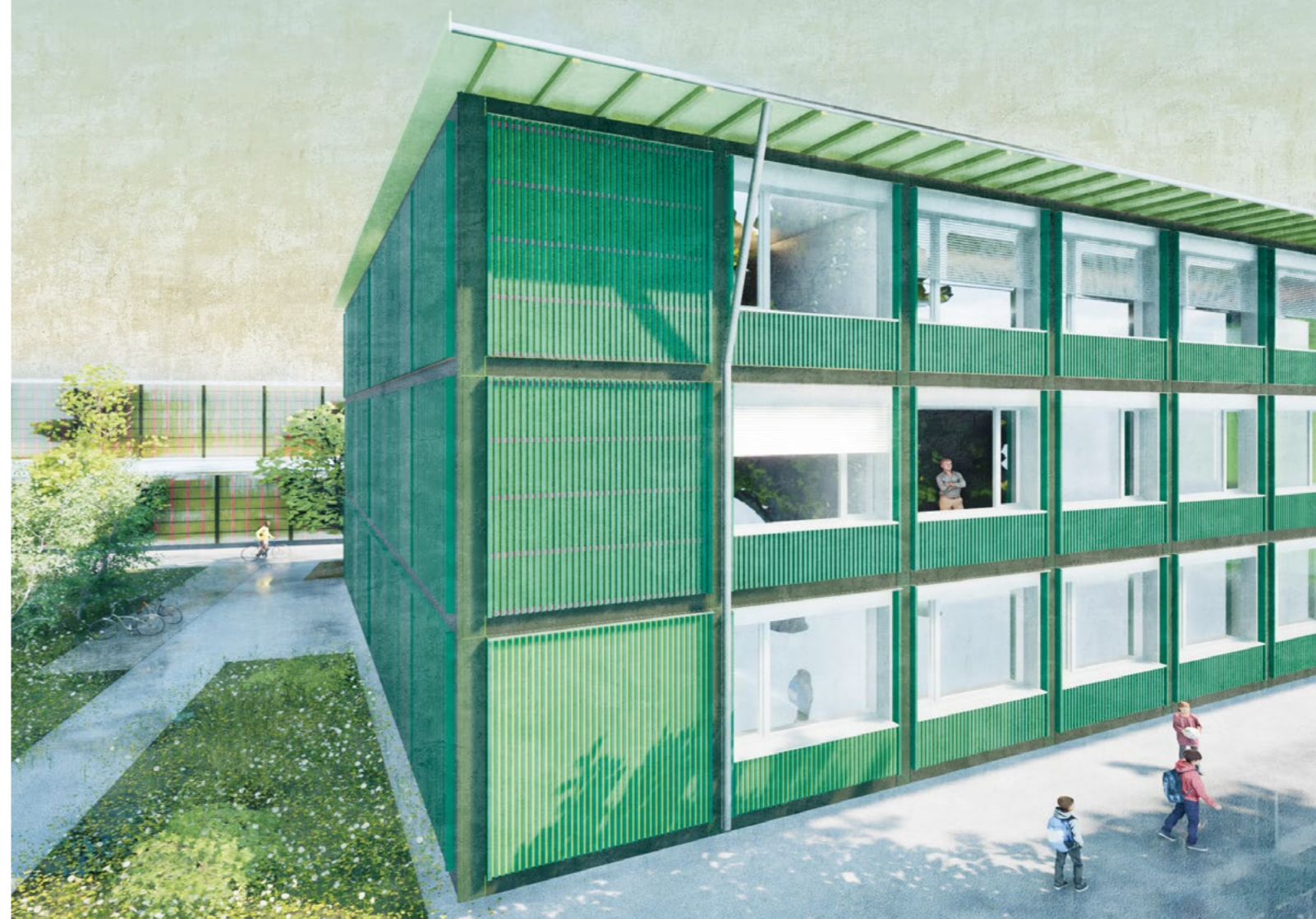
Bild Das neue Provisorium auf dem Empa-Gelände besticht durch seine grüne Fassade

Visualisierung Bauart Architekten und Planer AG