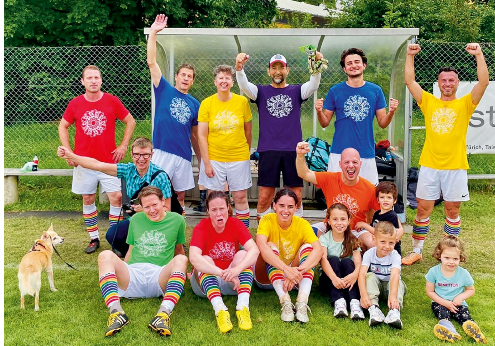
Bild Das Team HBA beendete das Turnier auf dem 2. Rang und ist mit 3 Siegen und zwei 2. Rängen das erfolgreichste Team in der zwanzigjährigen Geschichte des Architekt:innen-Fussballturniers