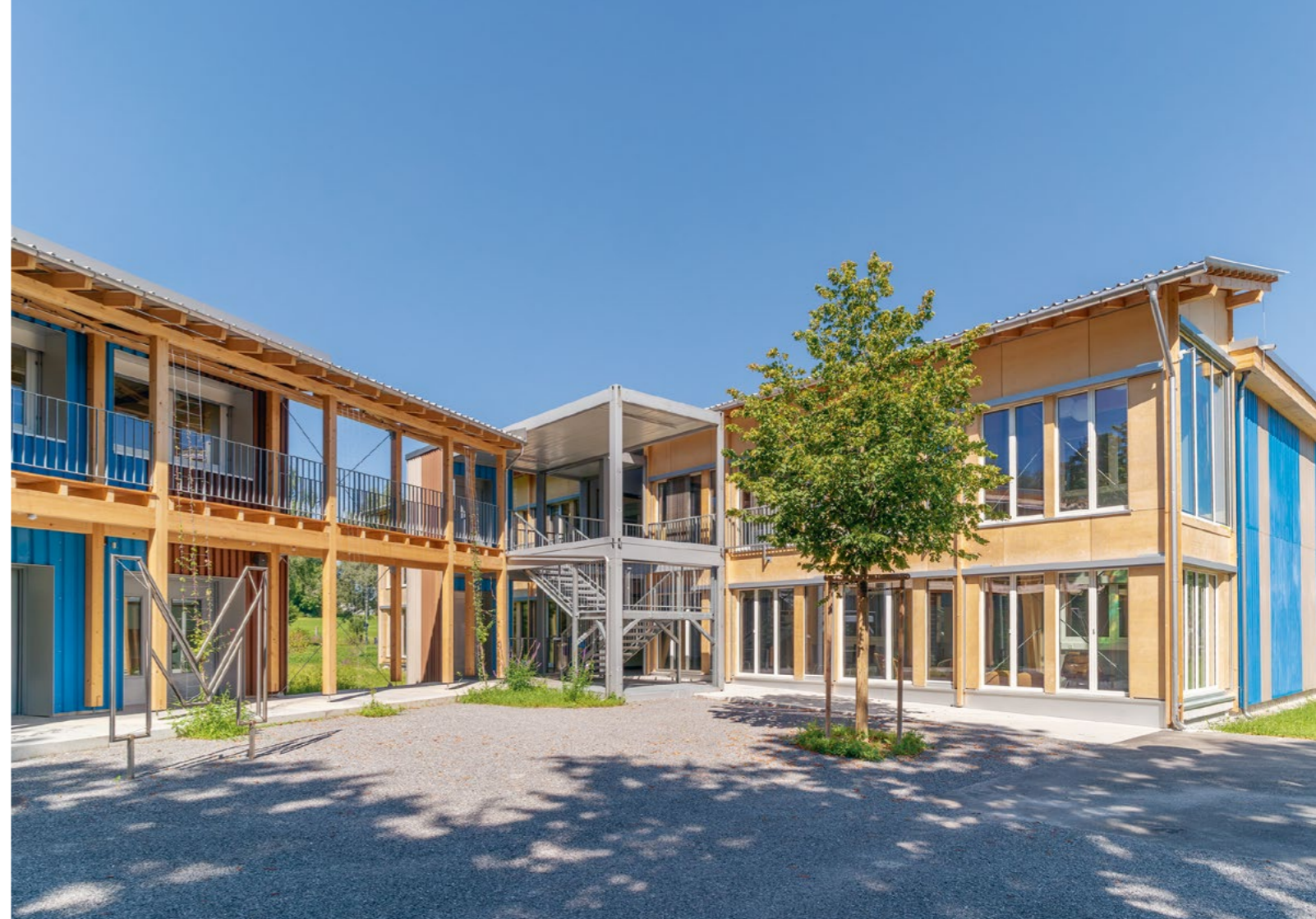
Bild Die beiden Erweiterungsbauten aus wiederverwendeten Bauteilen ergänzen den bestehenden Parkschulcampus