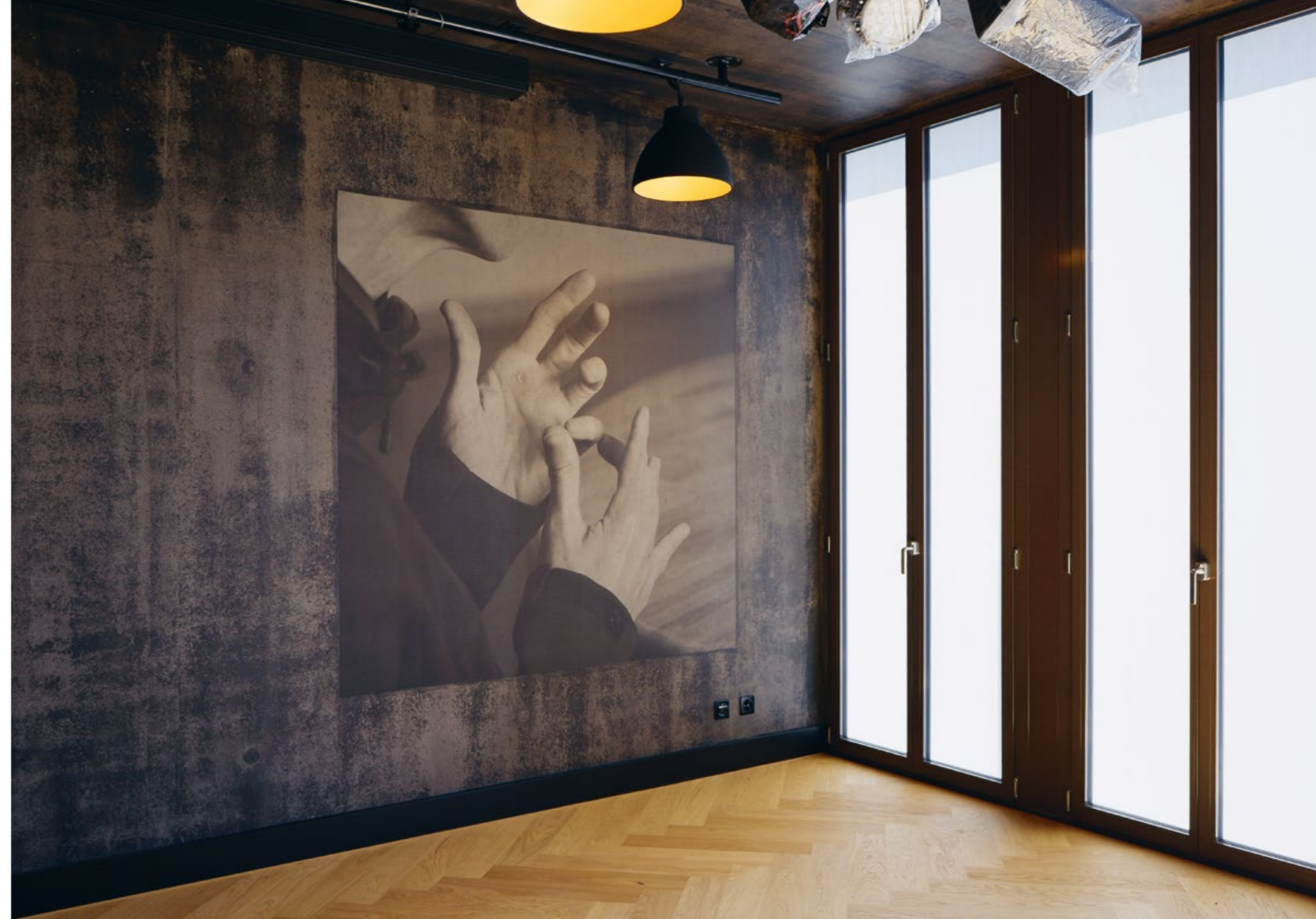
Bild Die fotografische Installation rückt die Bewohnenden des Wohnheims in den Mittelpunkt