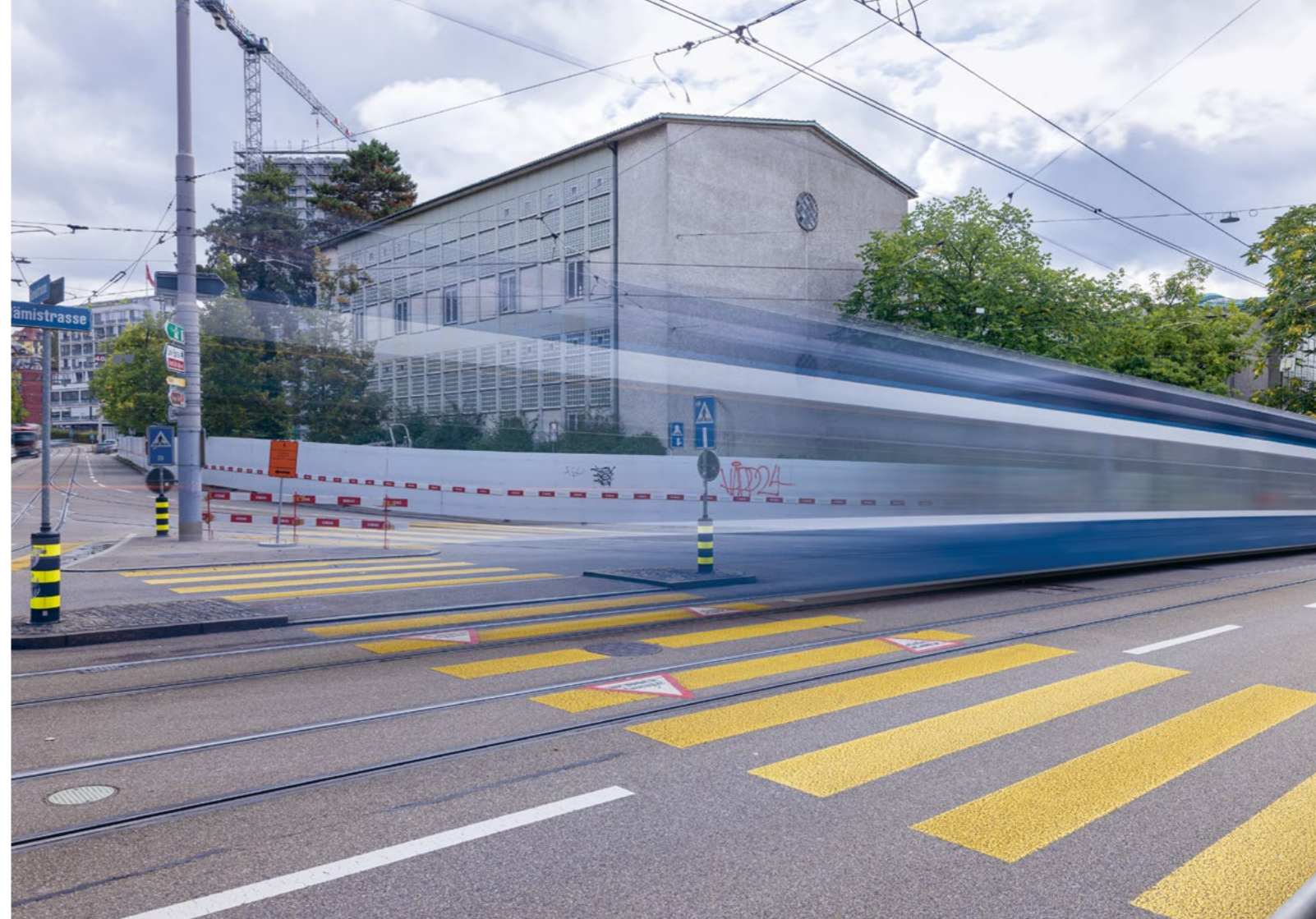
Bild Auf dem Areal Wässerwies wird das FORUM UZH entstehen – der Bauzaun steht bereits