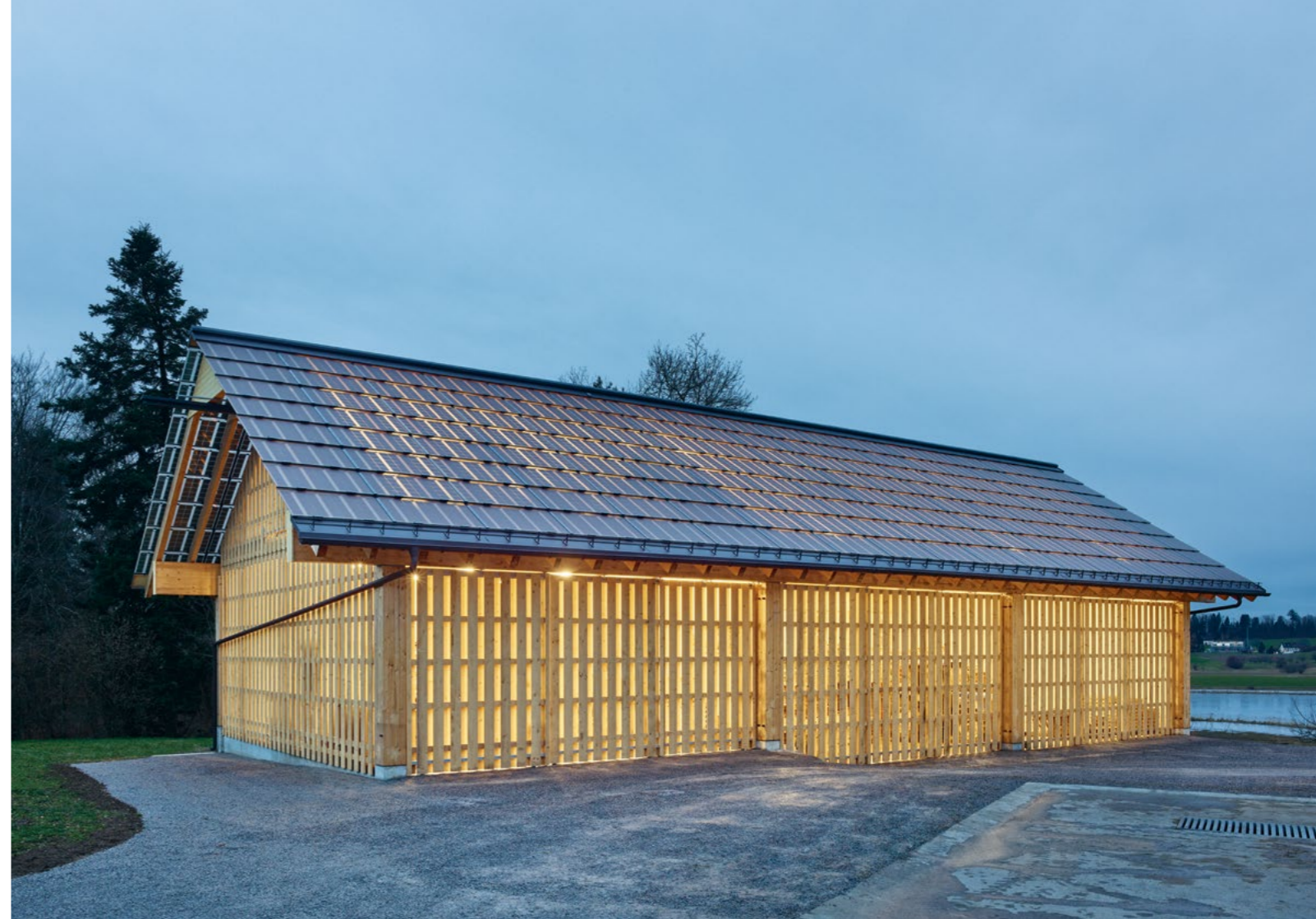
Bild Die neue Remise bietet dringend benötigten Platz für Geräte und Maschinen