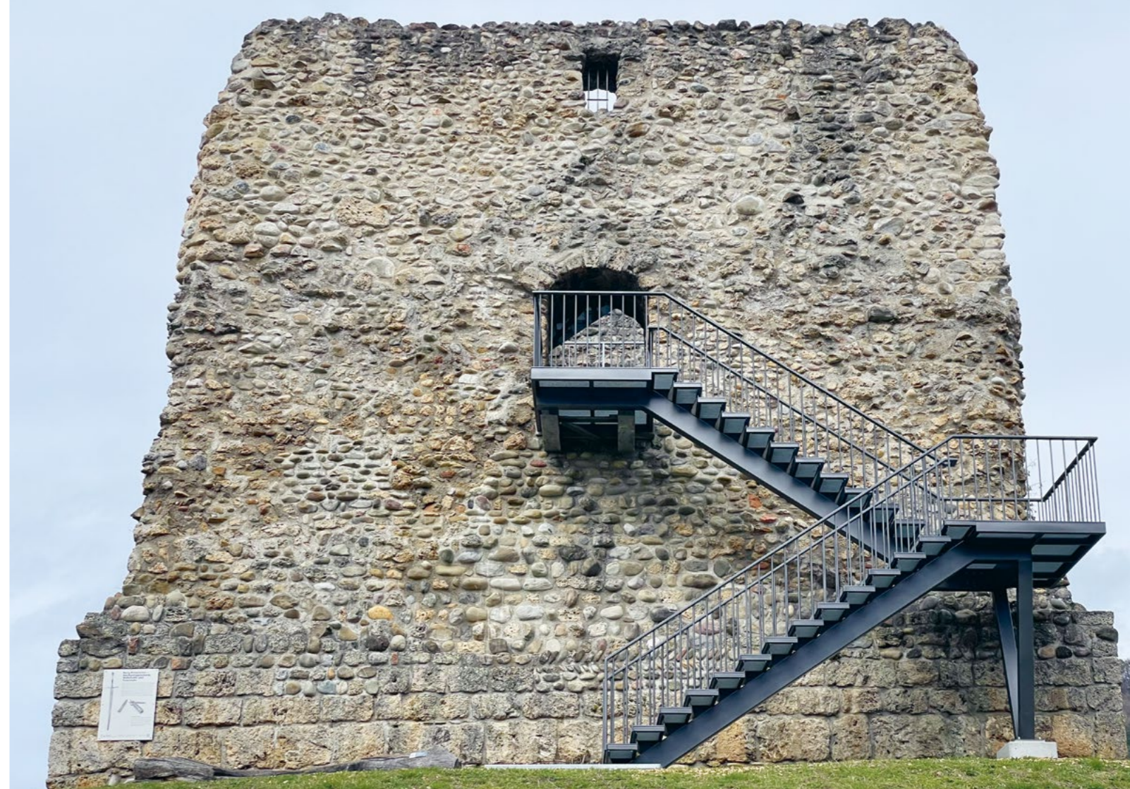
Bild Die Burgruine mit der neuen Aussentreppe, die alle Vorschriften erfüllt