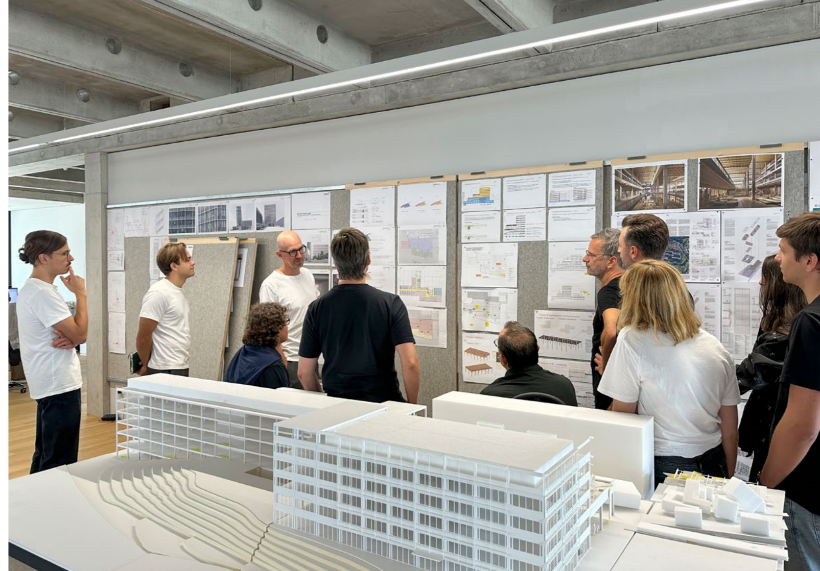
Bild Arbeitsbesprechung am Modell, Phase Vorprojekt