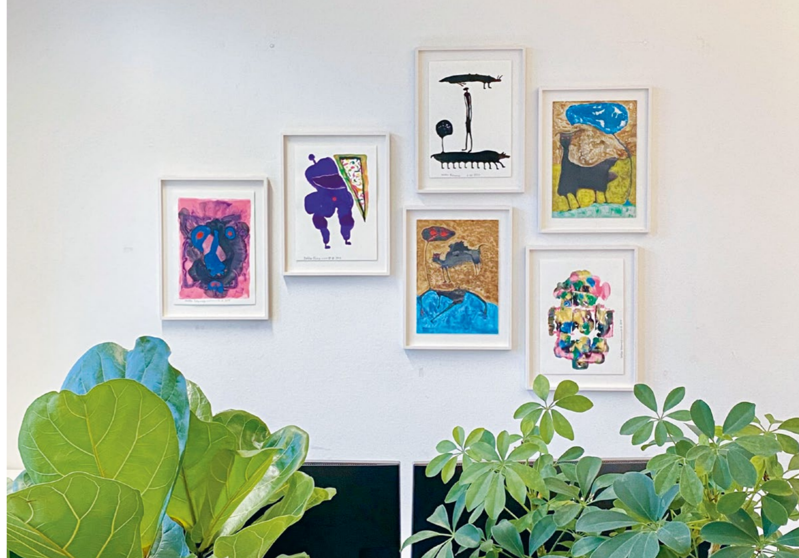
Bild Ein Teil der kuratierten Ausstellung im Büro der Förderbereiche Tanz & Theater und Literatur