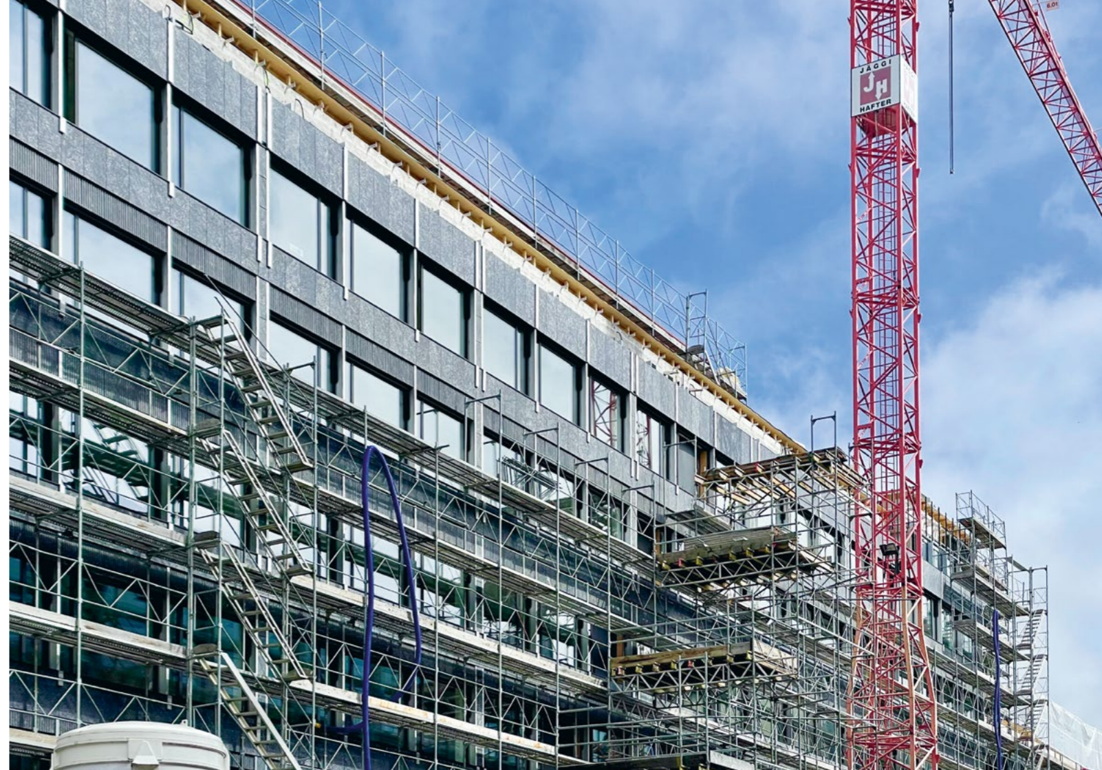
Bild Der Gerüstabbau bringt die strassenseitige Fassade aus Naturstein zum Vorschein