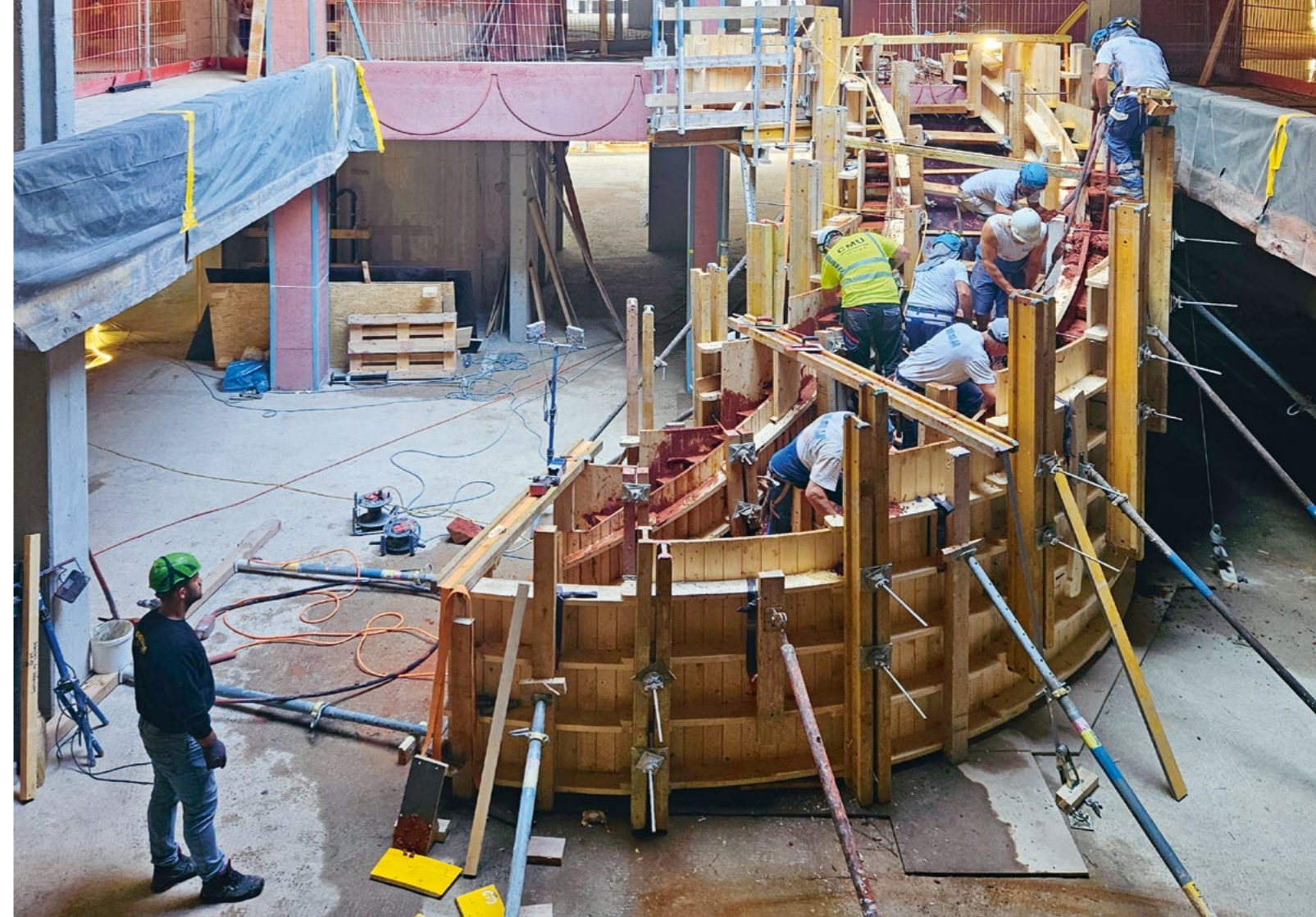
Bild Viele Hände packen an, um die rot eingefärbte Monobetontreppe in der Halle herzustellen