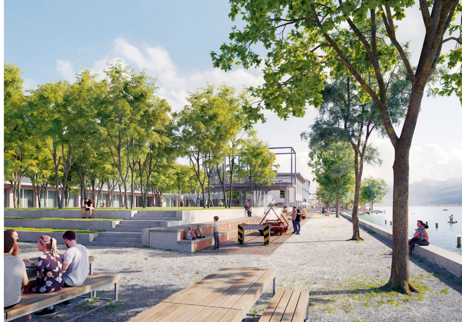
Bild Uferpromenade, Quai