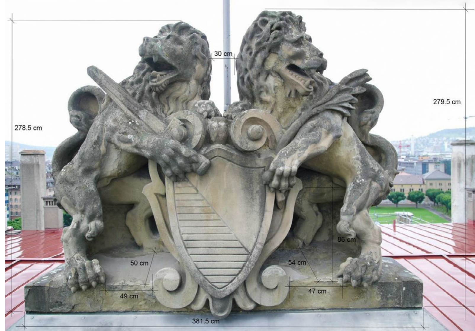
Bild Löwenpaar mit Wappen, Visualisierung der Vermessungsdaten