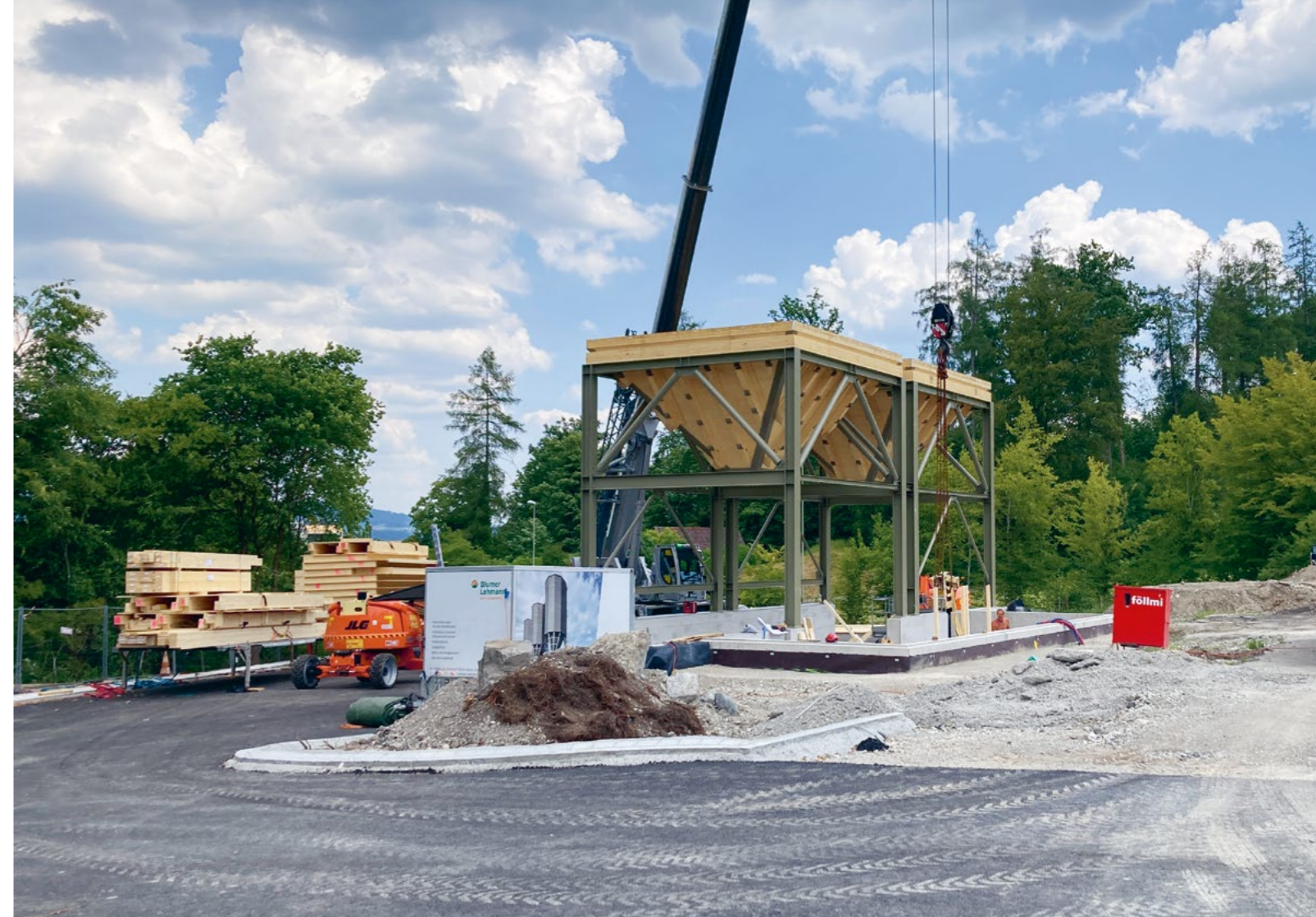
Bild Installation der Siloanlage