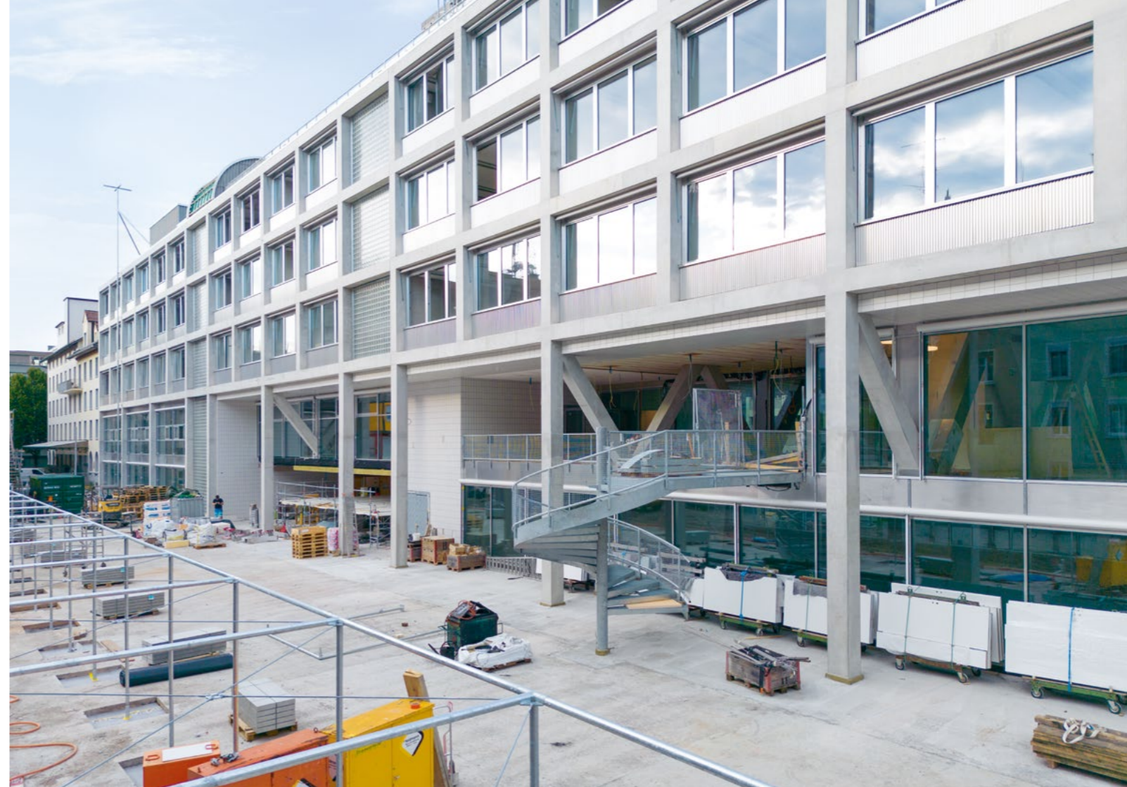
Bild Fassadenansicht des Ersatzneubaus von der Rückseite