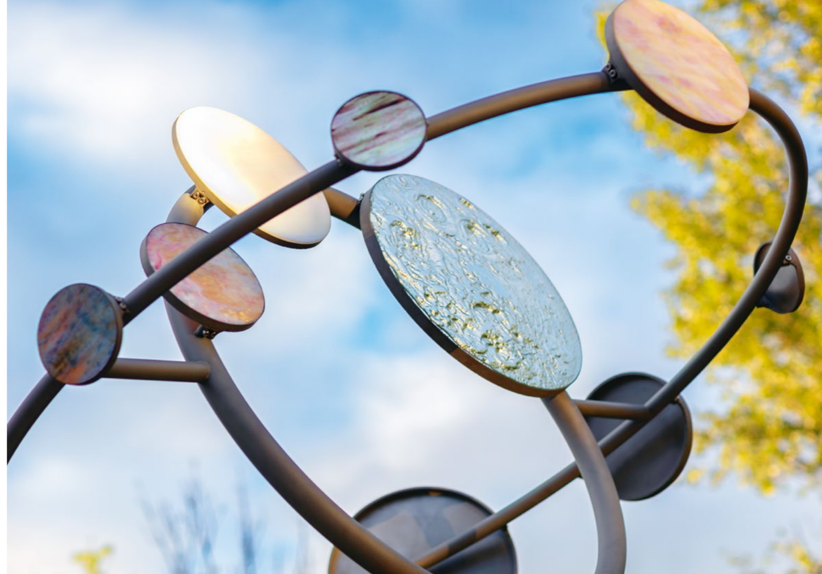
Bild Die Ausseninstallation besteht aus irisierenden und verspiegelten Glasscheiben