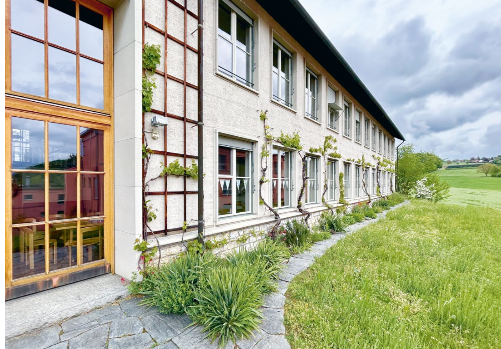
Bild Ansicht Südostflügel: Die denkmalgeschützten Fenster wurden instandgesetzt und teilweise ersetzt