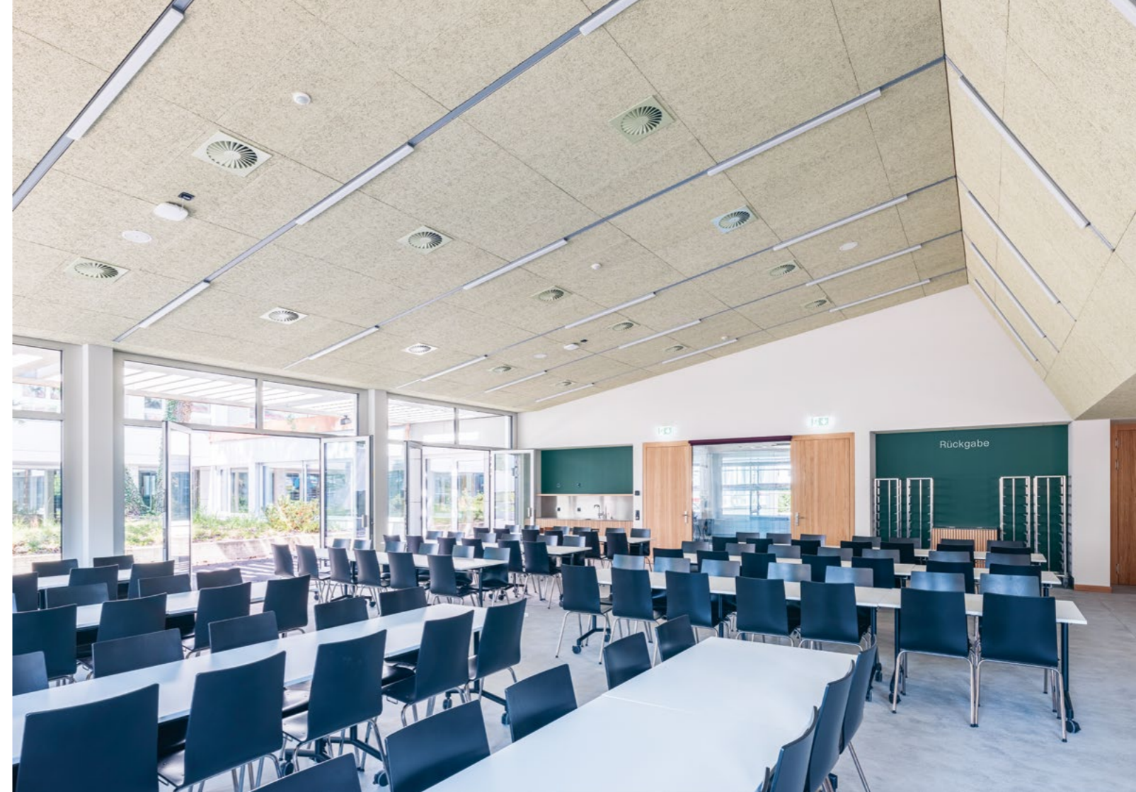
Bild Die neue Mensa bildet mit den bestehenden Gebäudeteilen eine neue Hofsituation