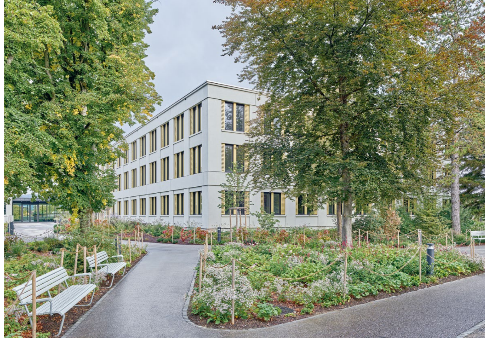
Bild Fassadenansicht mit Garten