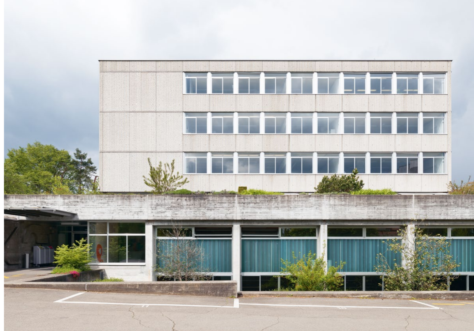
Bild Die Berufsschule ist für den Umbau bereit