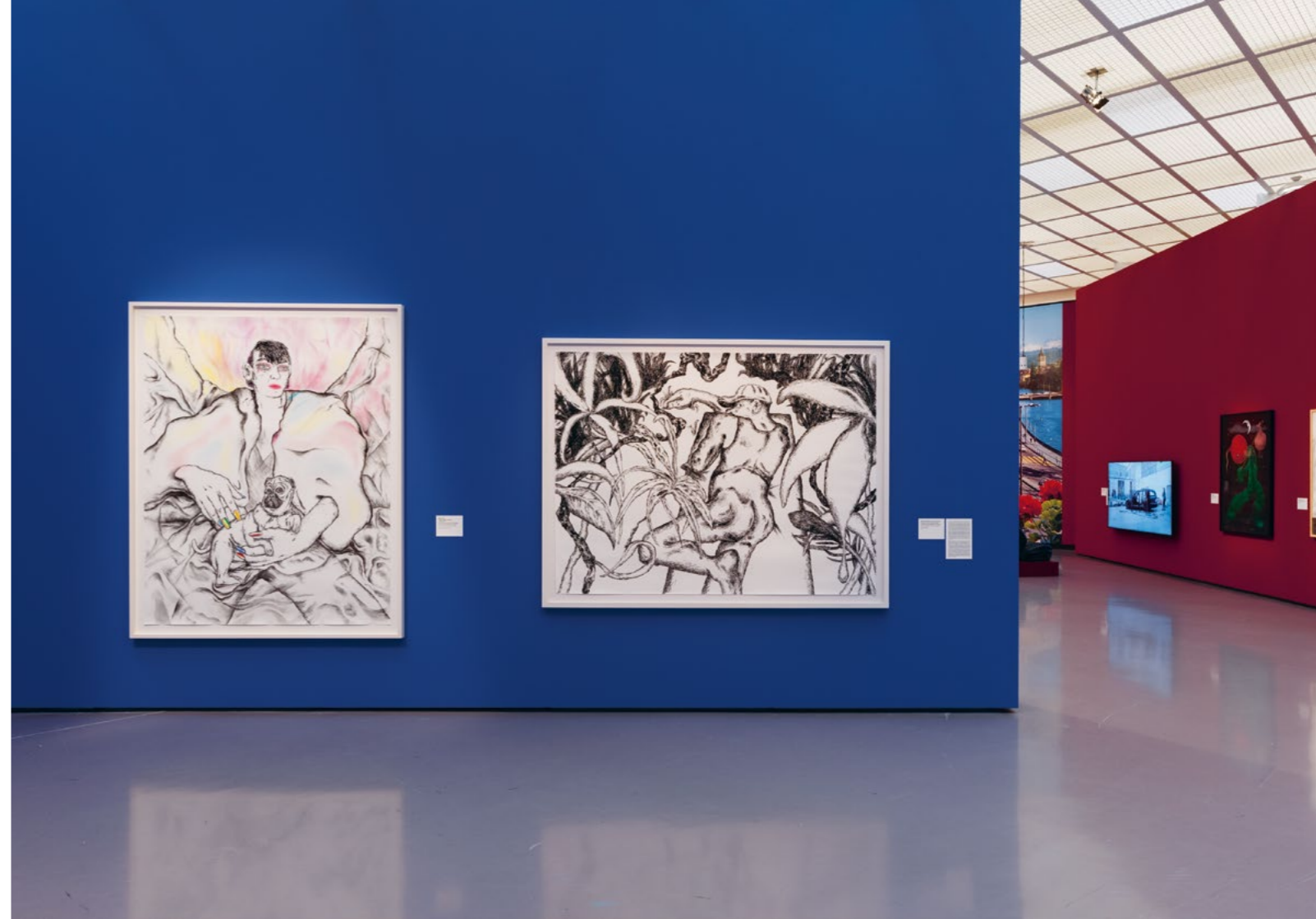
Bild Eine Leihgabe aus der Kunstsammlung für das Kunsthhaus Zürich (links im Bild)