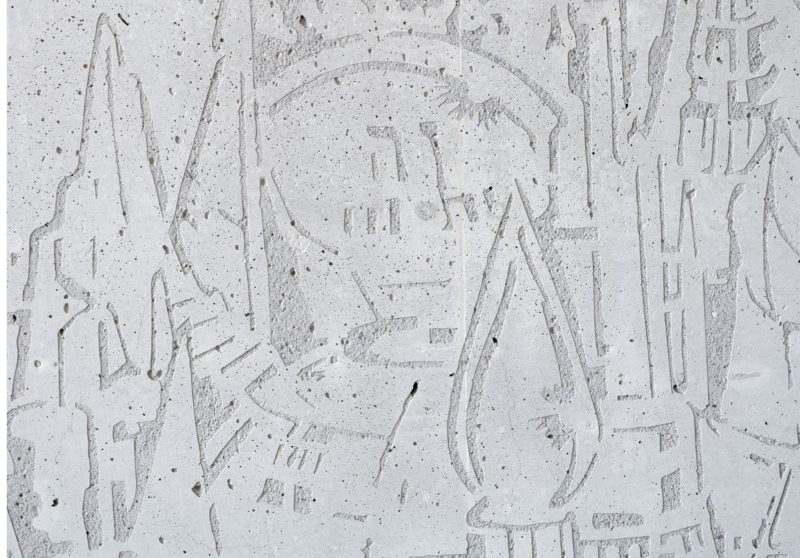
Bild Die in der ganzen Anlage verteilten 20 Figuren wurden mit einem Standstrahler direkt in den Beton graviert