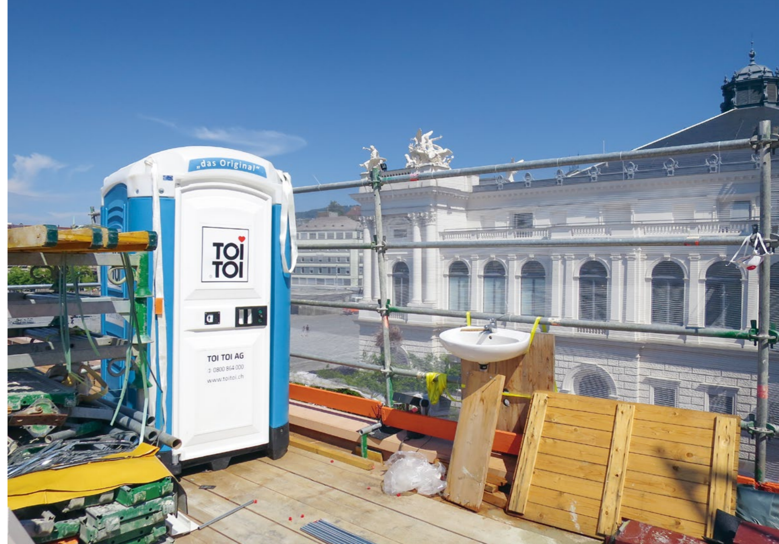
Bild Baustellen-WC an bester Lage