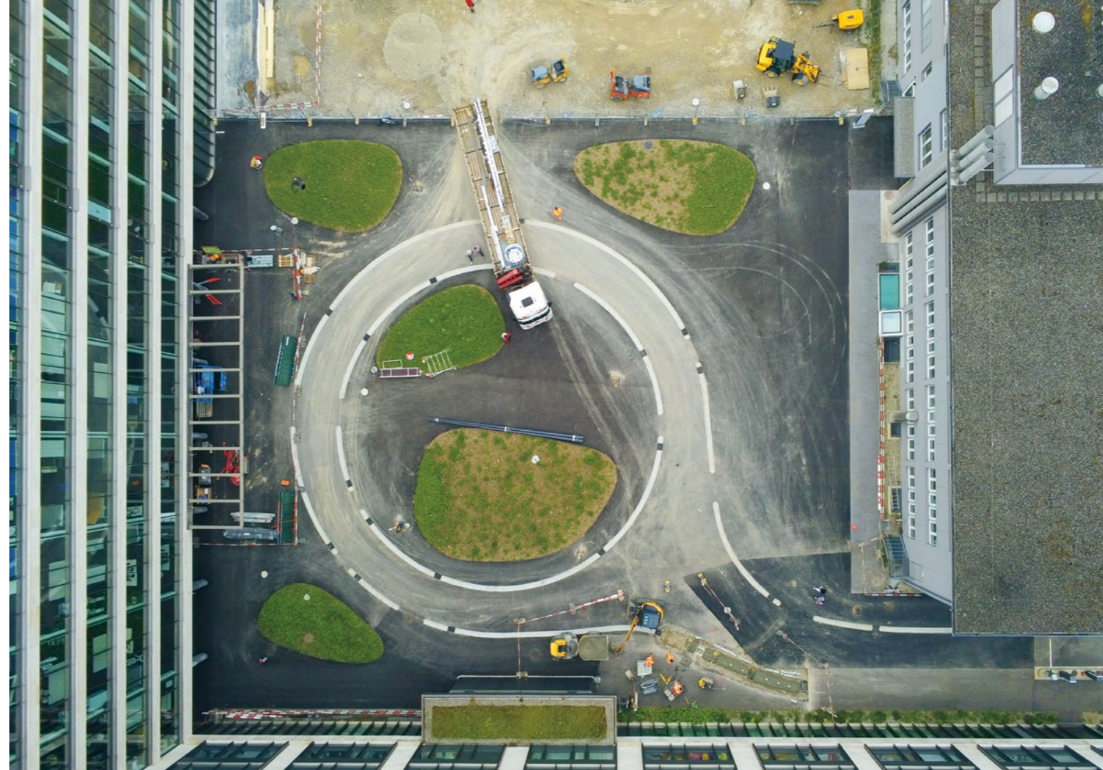
Bild Fertigstellung der Vorfahrt zum Ersatzneubau und Montage des Vordachs über dem Haupteingang