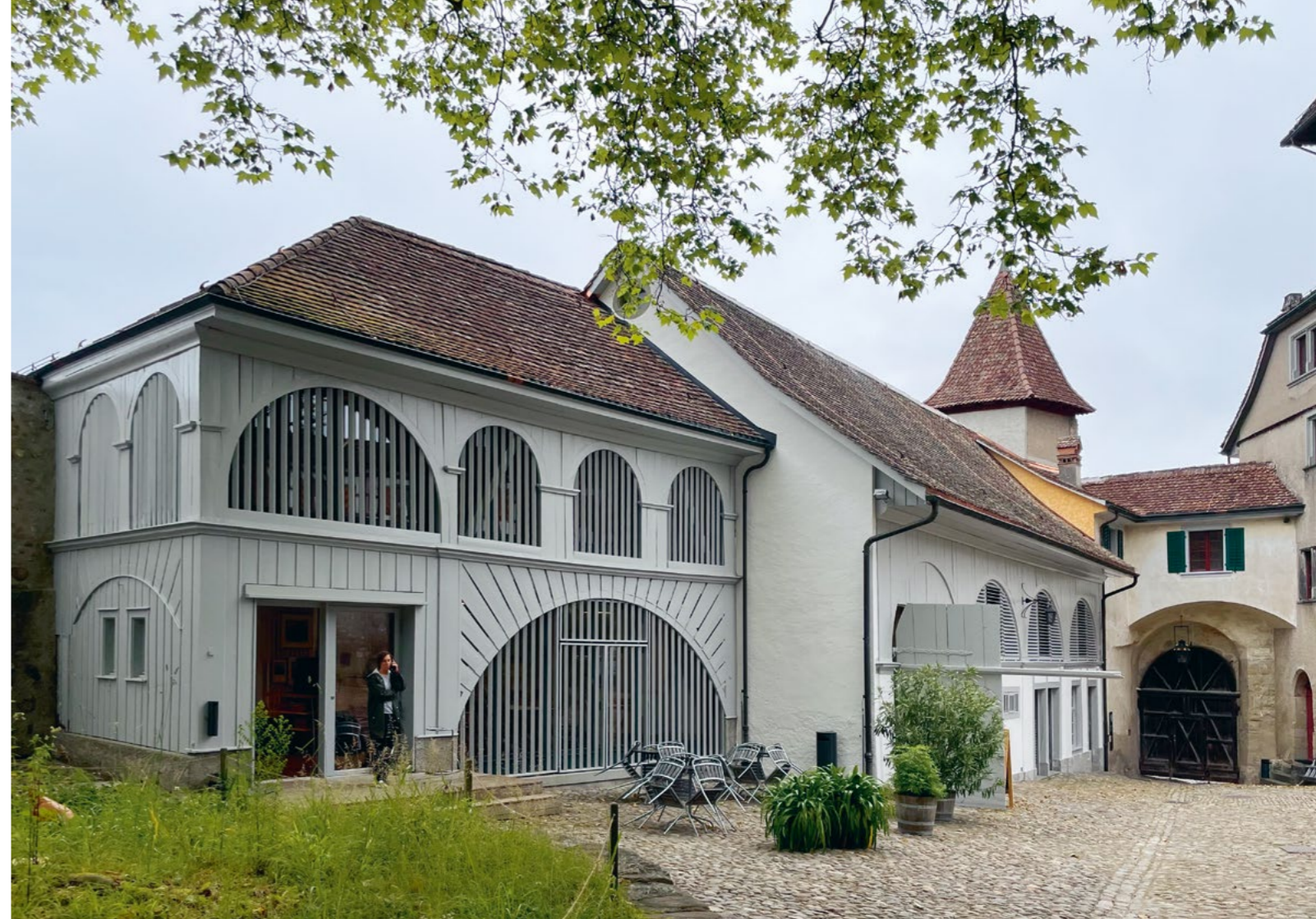
Bild Das Ökonomiegebäude nach der denkmalpflegerischen Instandsetzung