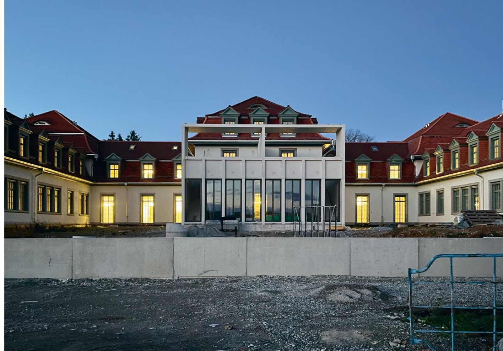
Bild Ausschnitt Hoffassade