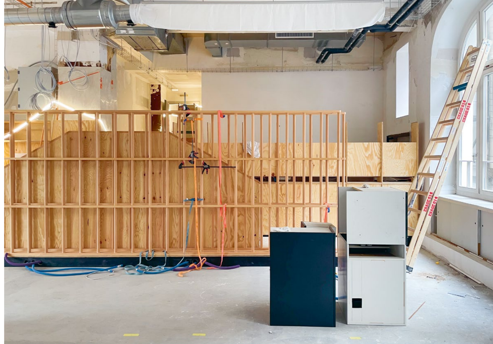
Bild Die Holzkonstruktion wird mit Textilien bezogen und dient als Raumtrenner und Schallschutzwand