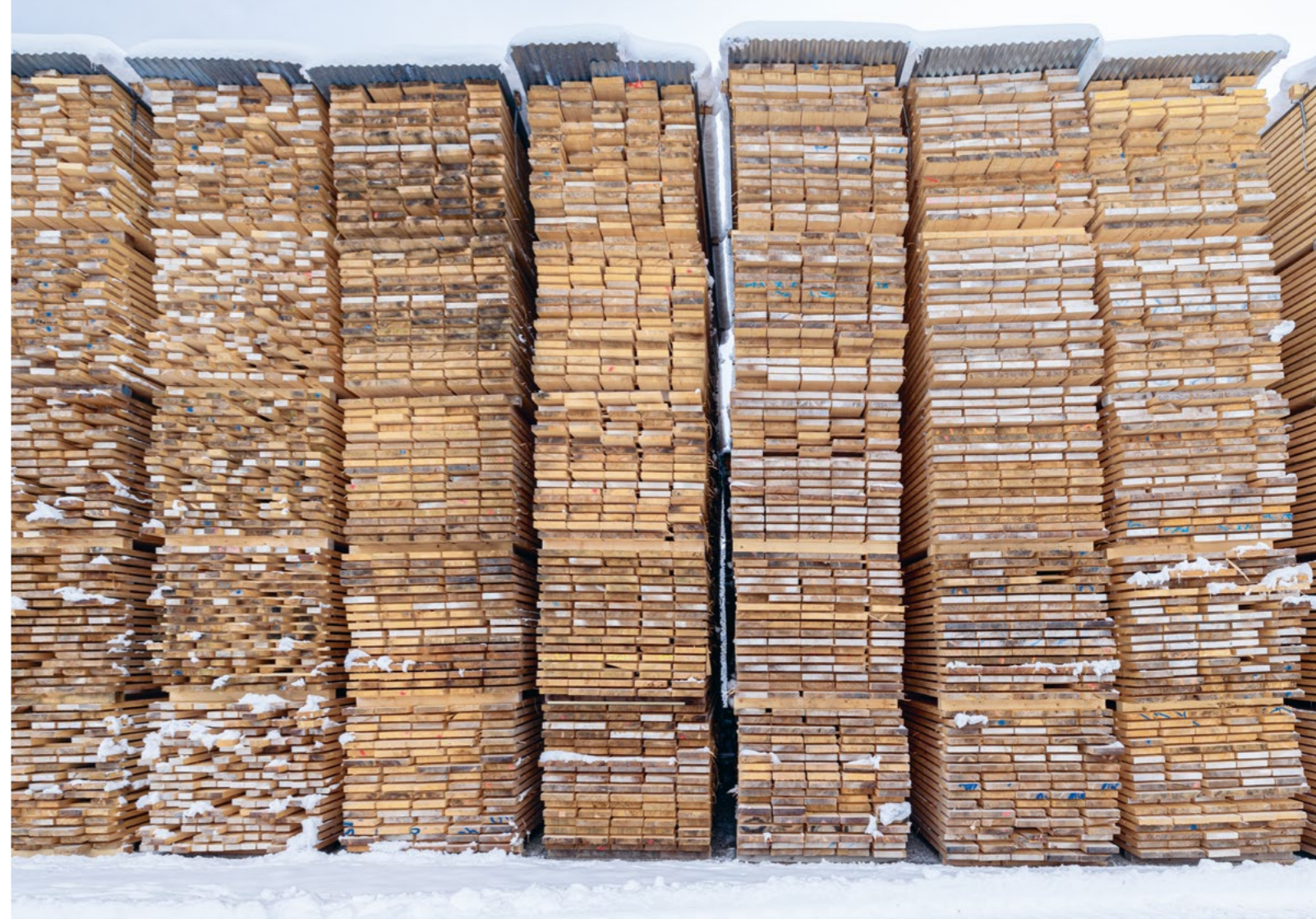
Bild Bereit für die Weiterverarbeitung: Holz aus dem Staatswald, geschnitten und geschichtet