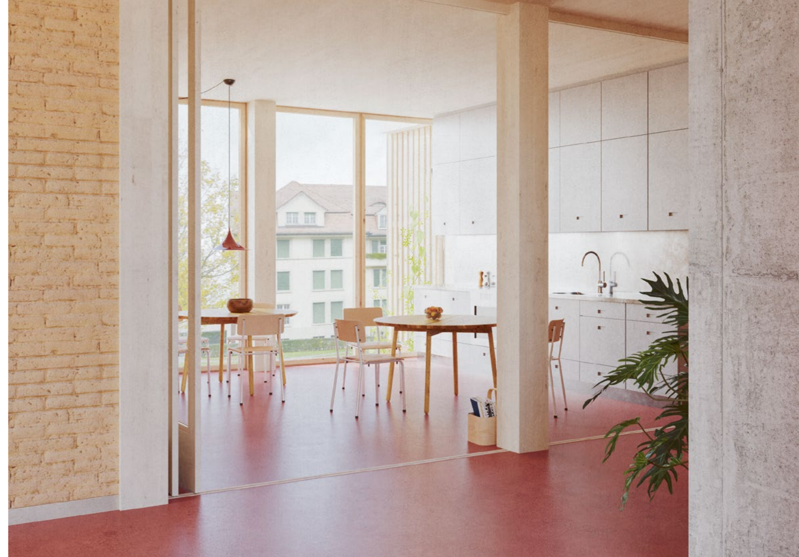
Bild Helle und offene Räume schaffen Sichtkontakt. Für Kinder mit Hör- und Sprachbeeinträchtigungen ist das besonders wichtig