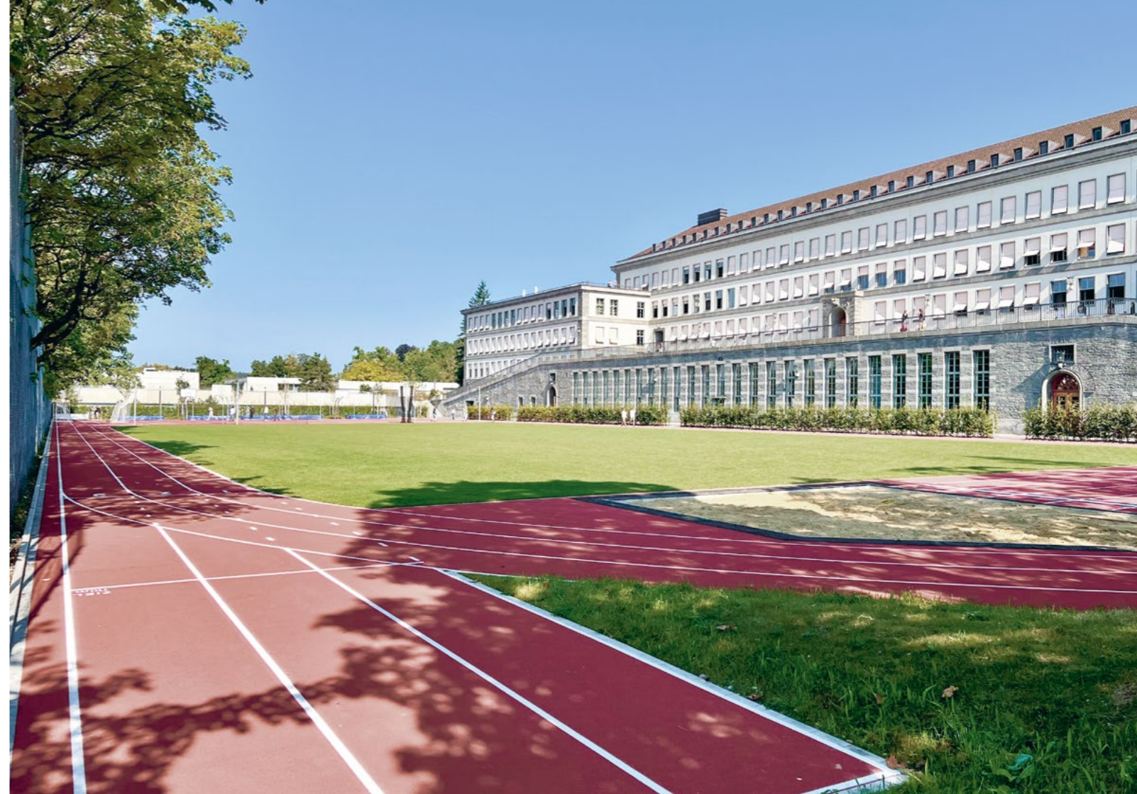
Bild Nach der Gesamtinstandsetzung der Schule ist nun auch der Sportplatz wieder bereit für Höchstleistungen