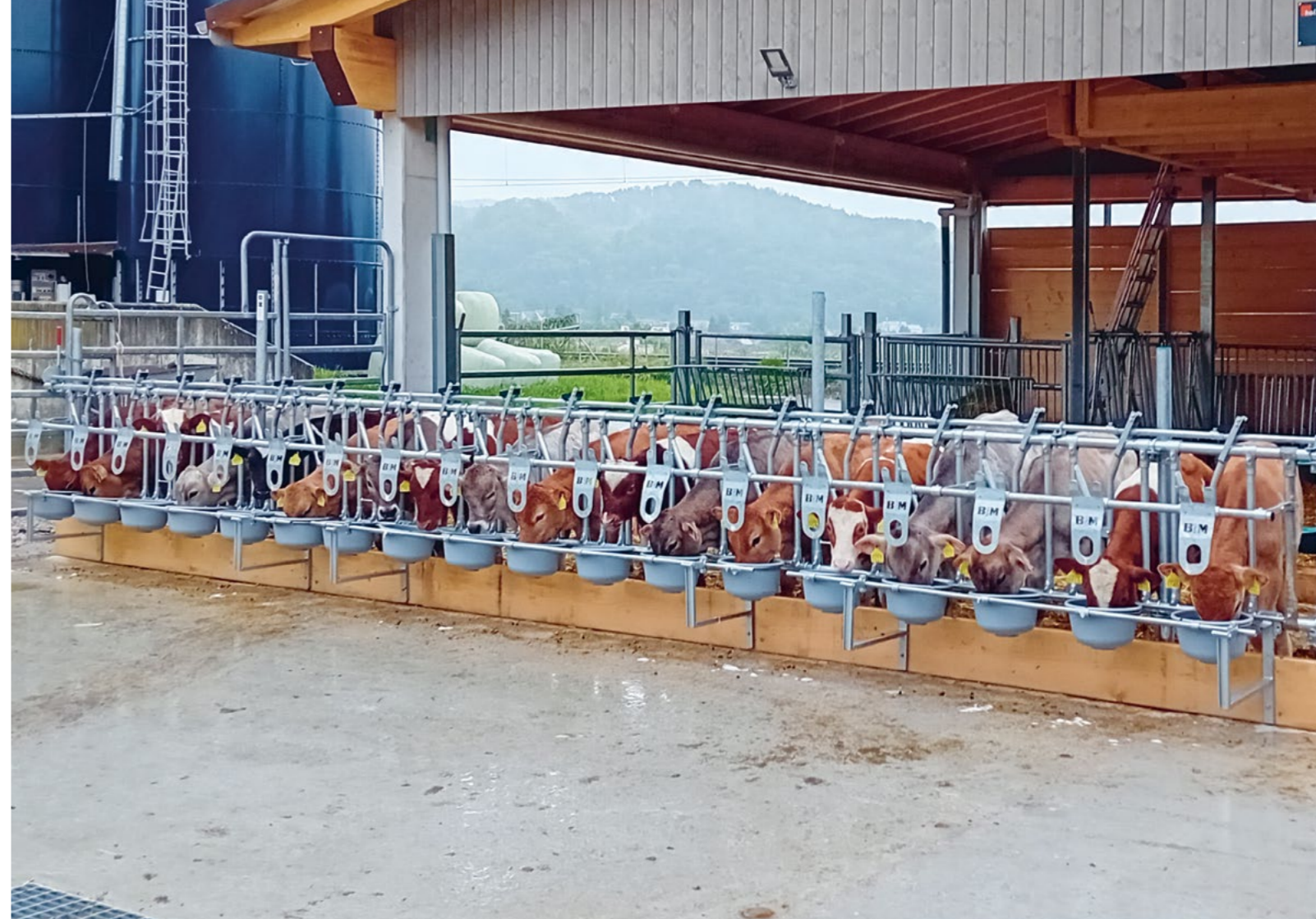
Bild Jungtiere im neuen Kleintierstall