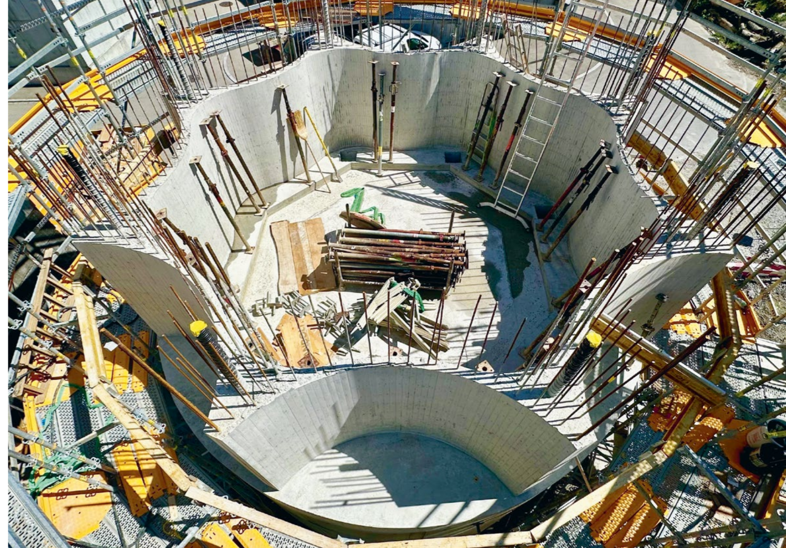
Bild Wasserturm beim Ausschalen von der Basis und der ersten Ebene