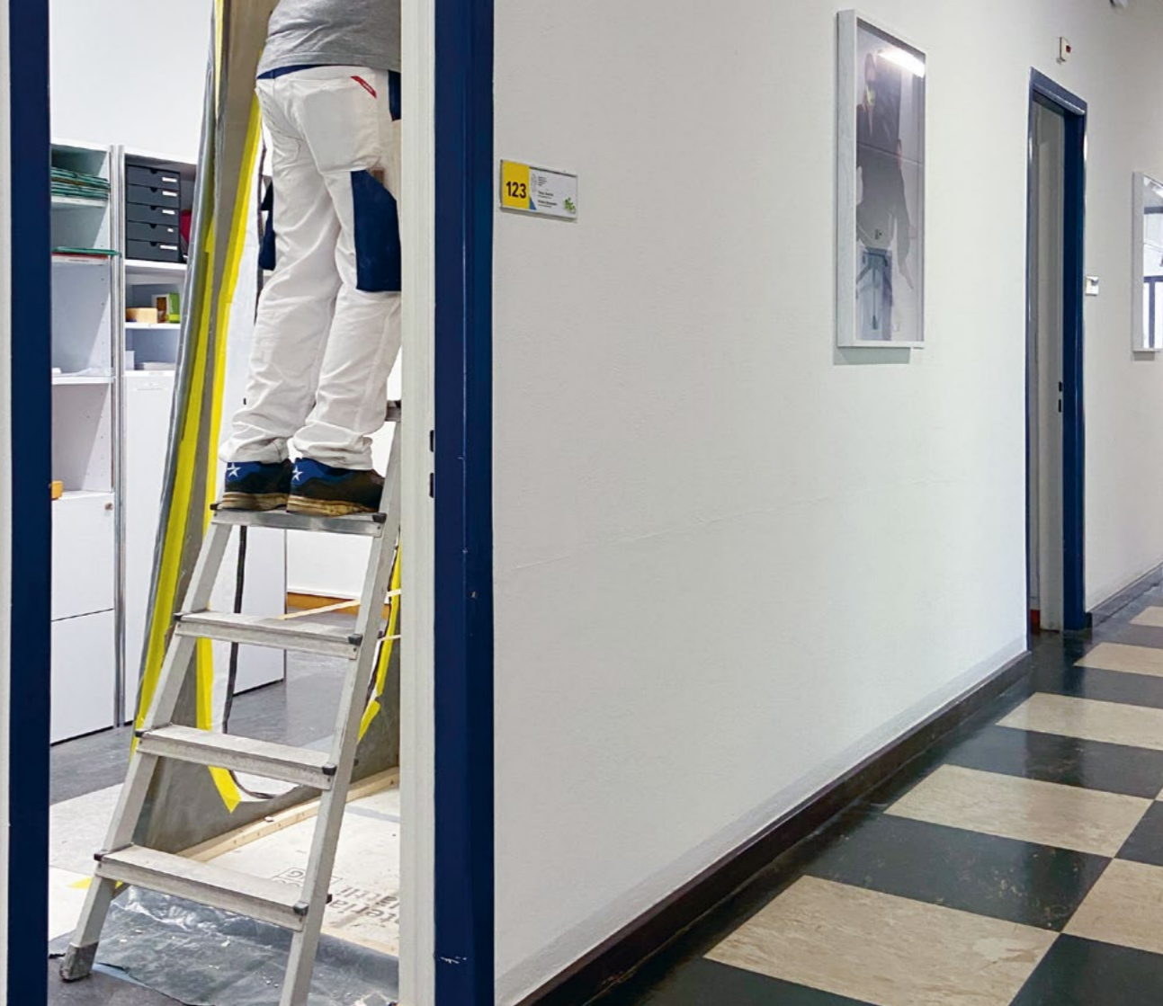
Bild Sondage des Tragwerks im Walcheplatz 1 im Rahmen der Zustandserhebungen