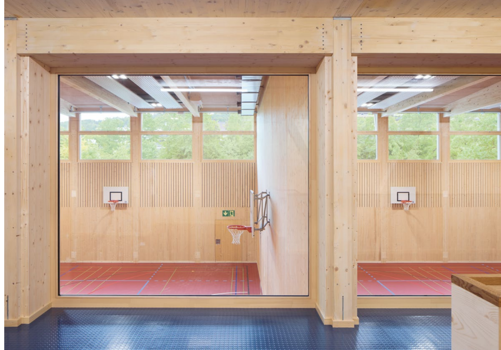
Bild Blick in die Sporthallen