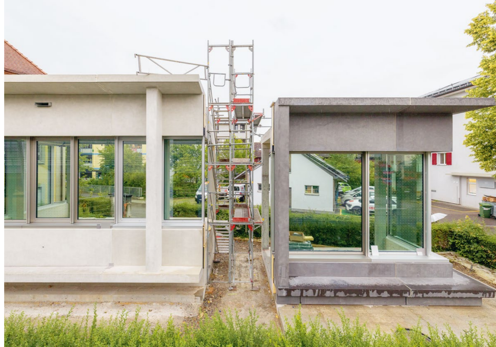
Bild Die Fassaden-Mock-ups der beiden Neubauten sind fertiggestellt