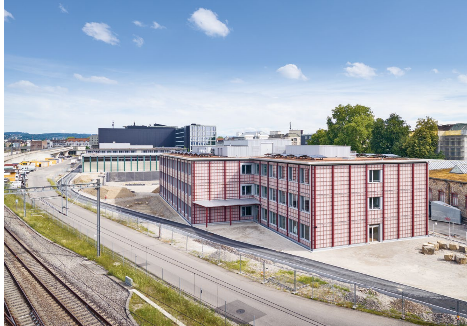
Bild Nach einer Bauzeit von zehn Monaten gibt es hier Platz für 650 Schülerinnen und Schüler