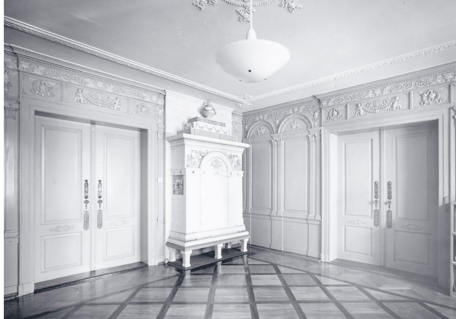
Bild Originalerhaltener Raum aus der ersten Bauzeit