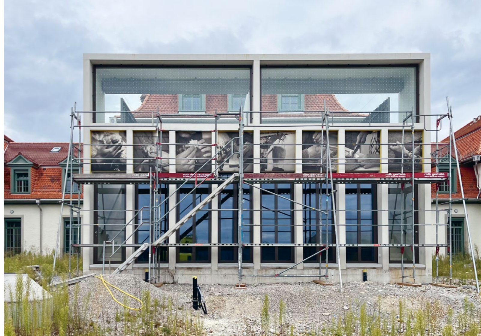
Bild Anbringen der Kunst an den neuen Erweiterungsbau