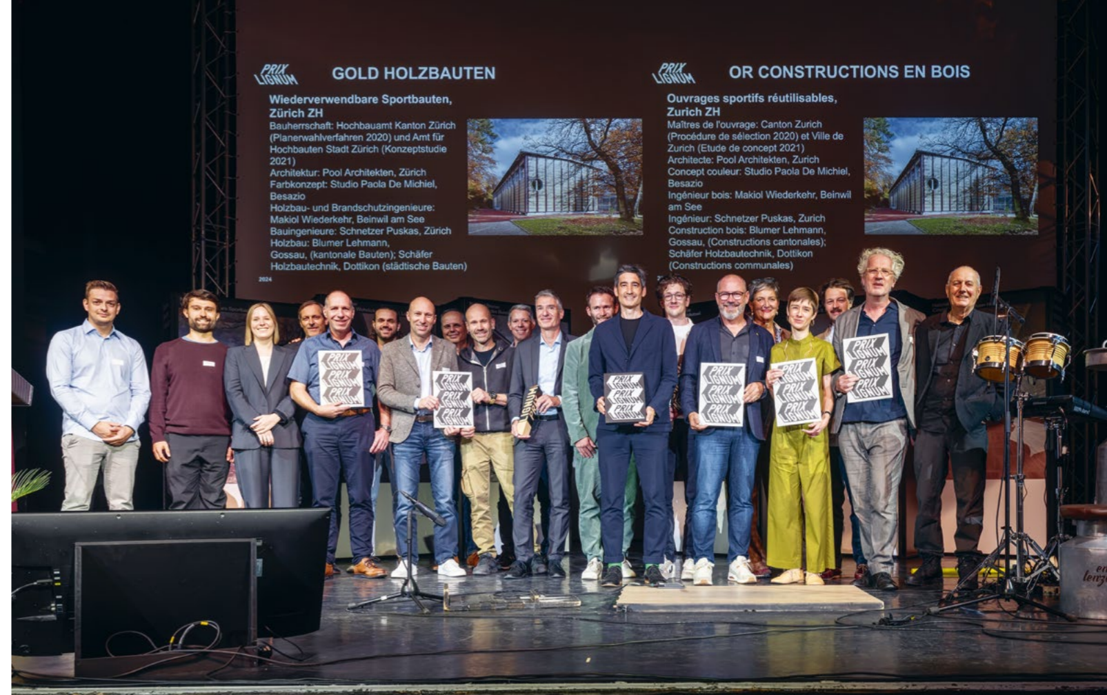
Bild Die feierliche Preisverleihung im Kursaal Bern