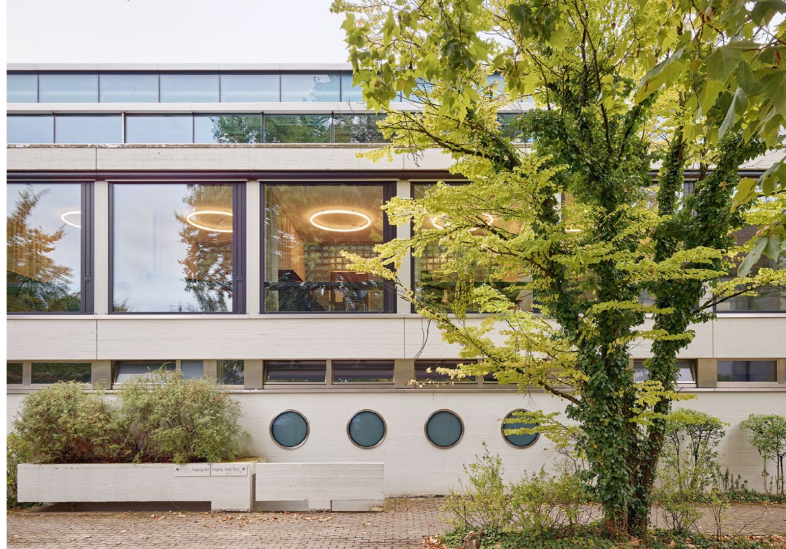
Bild Wieder aufgefrischt: Die Schule von 1967 ist im Inventar der schützenswerten Bauten