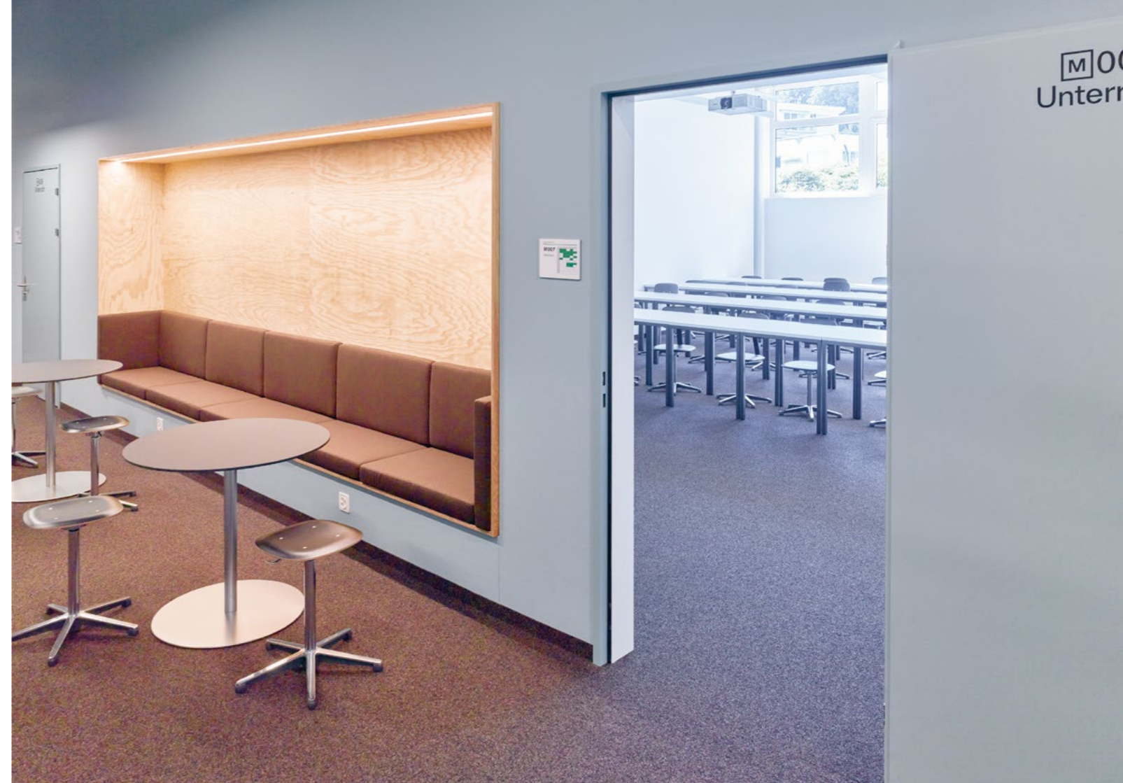
Bild Bis zum Bau der neuen Schule lernen die bisher 130 Schülerinnen und Schüler im Provisorium