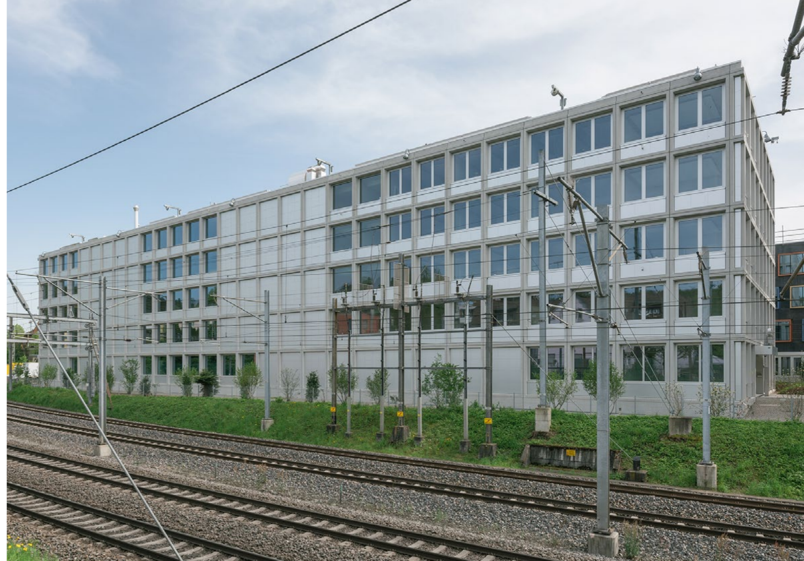
Bild Neubau für das Untersuchungsgefängnis, die Staats- und die Jugendanwaltschaft sowie für die Kantonspolizei