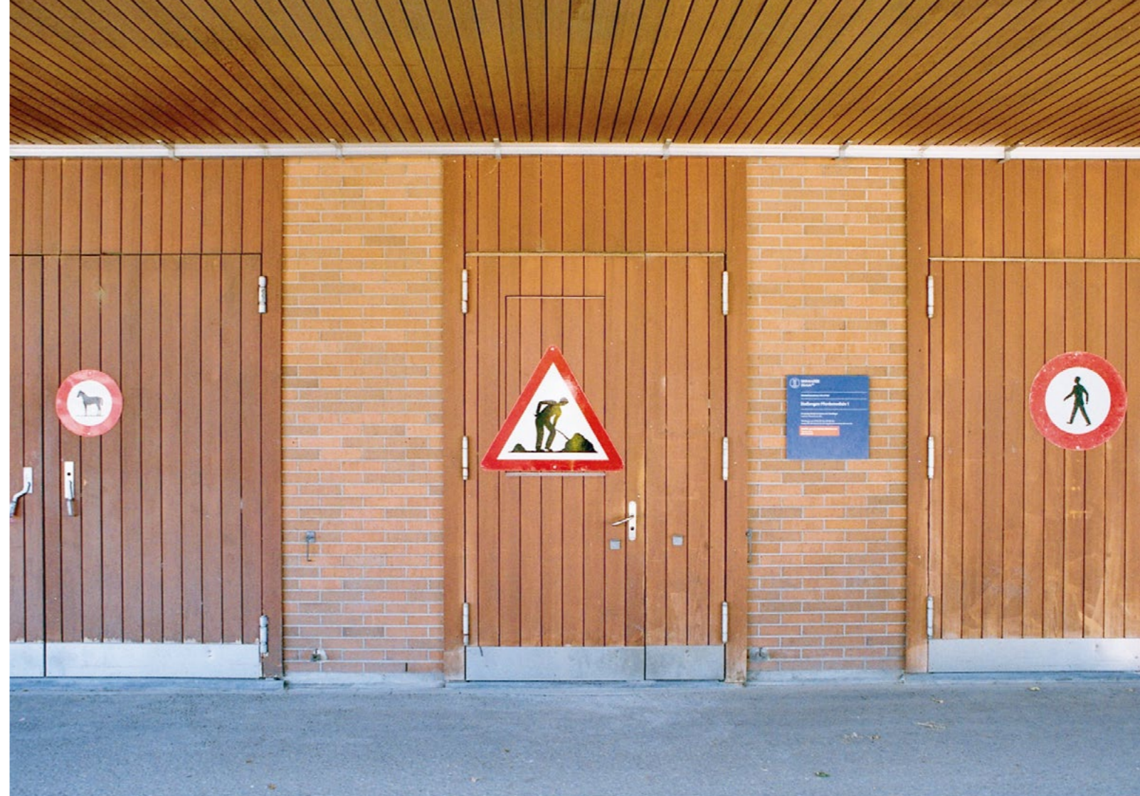
Bild Aussenansicht Stallgebäude TSB nach Baustart