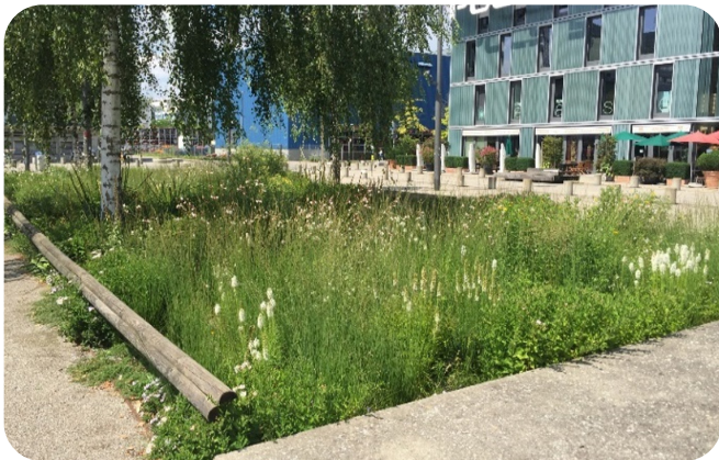
Versickerung mit Pflanzsubstrat, in die Platzabwasser mit geringer Belastung geleitet wird.

Einzuhalten ist ein Flurabstand zwischen 10-jährlichem Hochwasserspiegel und Pflanzgrubensohle von \geq 1.0 m. Die Grundwasserspiegel sind im kantonalen GIS-Browser ersichtlich oder können bei Gewässerschutzfachstellen nachgefragt werden.