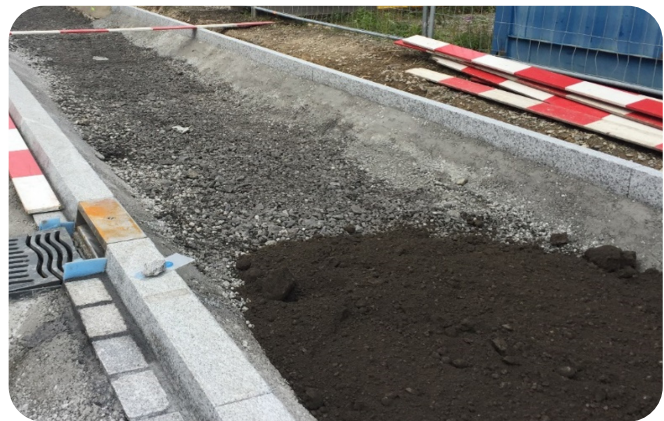
Lagenweiser Einbau von kompostierter Pflanzenkohle.

Pflanzenkohle kann nach heutigem Wissensstand langfristig keine gelösten Schadstoffe adsorbieren. Diese Eigenschaft ist im Substrat nur durch granuliert Aktivkohle zu erzielen.