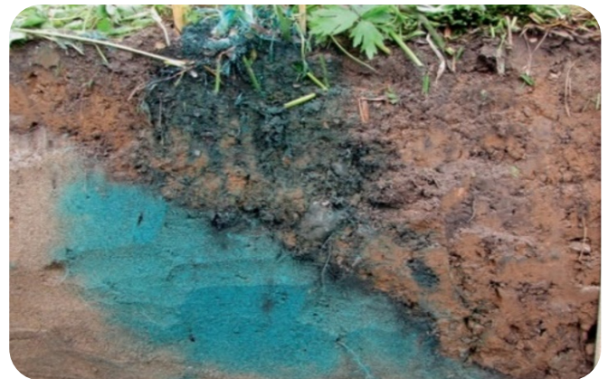
Strukturell bedingter Makroporenfluss im Boden, mit Farbtracer eingefärbt.