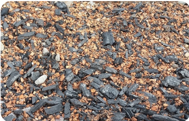
Mineralisches Pflanzsubstrat mit Ziegelschrot und roher Pflanzenkohle.

Damit sind hohe Feldkapazität (> 30 %) und gutes Bindungsvermögen für Nährstoffe sichergestellt.