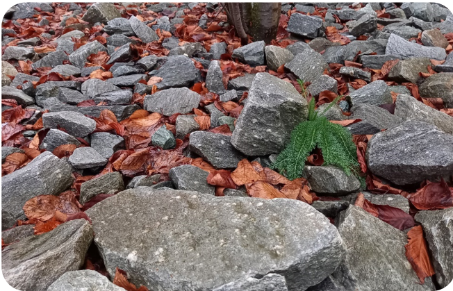
Hohe Tragfähigkeit und Durchlässigkeit mit Gestein.

Im richtungsweisenden Stockholmer Substrat bedingt das Grobmaterial (85 %, 100/150 mm Gestein) eine sehr hohe Wasser-/Luftdurchlässigkeit, Durchwurzelbarkeit und Tragfähigkeit. Die kompostierte Pflanzenkohle (15 %) dient der Wasser-/Nährstoffspeicherung und filtert eingetragene Partikel (GUS) heraus. Der Einbau erfolgt mit einer Unterlage reiner Pflanzenkohle, gefolgt von Grobmaterial mit eingeschlammter kompostierter Pflanzenkohle und einer kiesigen Trag-/Belüftungsschicht (32/90).