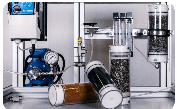
Labortest zur Bestimmung des Stoffrückhalts von Pflanz- und Adsorbersubstraten.