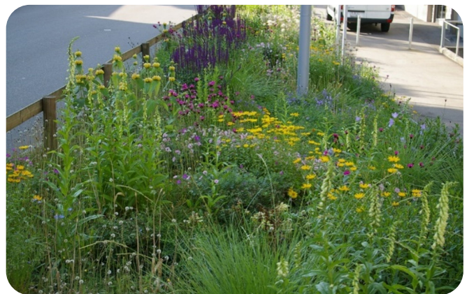
Feuchter Standort mit hoher Salzlast und mittlere Belastung durch Wege- und Strassenabwasser.

Bäume, Sträucher und Stauden sind standortangepasst zu wählen (Hintergrundinformationen, Seite 6). Mit Pflanzenkohle, Belüftungsmassnahmen und gering verdichtetem Substrat lässt sich die Wurzelrichtung lenken. So treten die genetischen Grundtypen in den Hintergrund und es lassen sich Schäden an der Infrastruktur vermeiden.