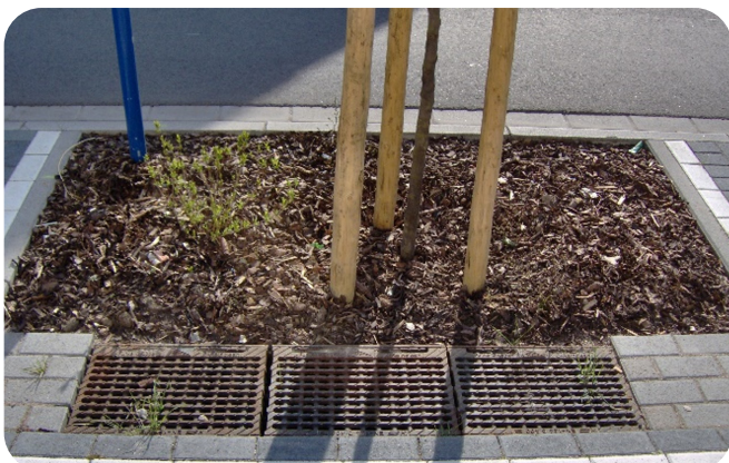
Adsorberrinne zur Behandlung von Strassenabwasser und Baumriegoie mit Pflanzsubstrat zur Versickerung.