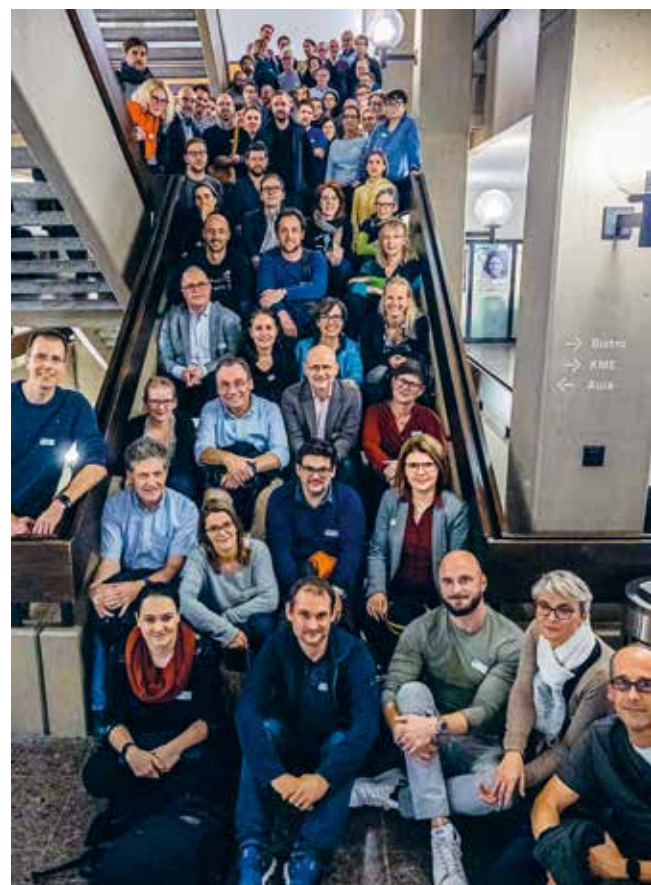
Der erste Vernetzungsworkshop des Digital Learning Hub war ein voller Erfolg: 140 Personen waren da, gekommen wären gern noch mehr.

und brachte Kunst und Kultur nach innen. Lernende, Lehrende, Hausdienst und Verwaltung waren zu einem gemeinsamen Wintermahl eingeladen. Die Zusammenarbeit intensivierte das kulturelle Interesse und regte neue Formen der Kulturvermittlung an. [red]