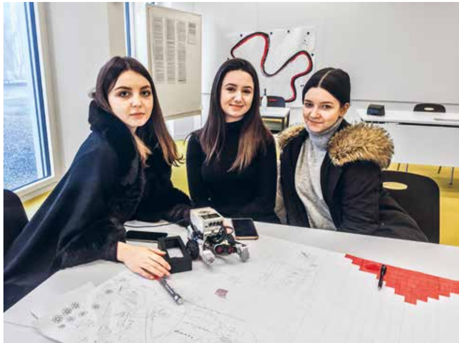
Während einer Projektwoche an der Berufsfachschule Uster entwickelten KV-Lernende in Teams den Prototyp eines selbstfahrenden Transportfahrzeugs.

Während der einwöchigen Projektwoche lernten sie alle notwendigen Prozesse einer Wertschöpfungskette von der Entwicklung eines Prototyps bis hin zur Online-Vermarktung kennen (Industrie 4.0). Sie erlebten die Zusammenarbeit in berufsübergreifenden Teams, wie sie heute in der Wirtschaft üblich sind (Arbeitswelt 4.0). Neben traditionell kaufmännischen Fähigkeiten stand auch der Erwerb berufsübergreifender, sogenannter transversaler Kompetenzen im Fokus. Die KV-Teams wurden von Lernenden der technischen Berufe Automatiker/in EFZ der Berufsfachschule Uster und Konstrukteur/in EFZ der Berufsschule Rüti sowie von Lehrpersonen aus Wirtschaft & Technik unterstützt. In diesem Projekt wurden sämtliche als «Future Skills» bezeichnete Kompetenzen (4 Cs) Critical Thinking, Creativity, Collaboration und Communication angesprochen. Zudem wurde auch die von manchen Bildungsforschern als fünftes C geforderte Kompetenz Computational Thinking erfüllt. [red]