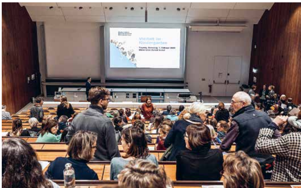
Die Tagung «Vielfalt im Kindergarten» an der Universität Zürich Irchel stiess auf grosses Interesse.

Der Bedarf an Schulassistenzen ist in den letzten Jahren stark gestiegen. Insbesondere in den Kindergärten hat sich diese Unterstützung zum Schuljahresbeginn bewährt. Das Volksschulamt hat nun eine Online-Stellenbörse lanciert, die es für Schulen und Gemeinden einfacher macht, geeignete Schulassistenzen zu finden. Gleichzeitig bietet die Stellenbörse den Stellensuchenden eine zentrale Plattform. Bewerber und Bewerberinnen sollten eine abgeschlossene Berufsausbildung oder einen Mittelschulabschluss mitbringen, Freude am Umgang mit Kindern und Jugendlichen haben und über gute Deutschkenntnisse und grundlegende EDV-Kenntnisse verfügen. Die Stellenbörse für Schulassistenzen ist bereits die zweite Plattform für eine Berufsgruppe,