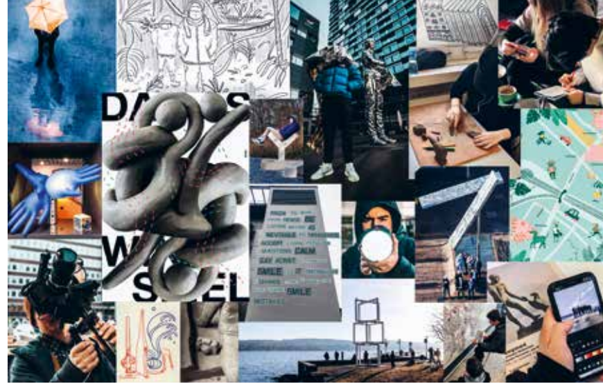
Während der Kulturwoche 2020 erforschten Lernende der Berufsschule für Gestaltung Kunstwerke im öffentlichen Raum und griffen selbst gestalterisch ein.